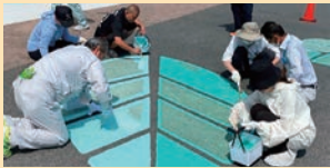
▲イベントのイメージ

明るく親しみやすい区役所づくりを推進するため、年齢や障害の有無などに関係なく、広く区民が参加して区役所敷地の一角に絵を描くペインティング・イベントを実施します。3月20日(祝)13時から、小倉北区役所東玄関前で。定員40人(抽選により決定。中学生以下は保護者の参加が必要。集合時間は参加者へ個別に連絡)。 甲 2月20日までに二次元コード(右記を読み取り)から 甲 を。 問 小倉北区役所総務企画課☎582・3130へ。