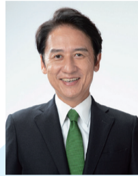
北九州市長 武内 和久