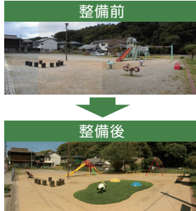
〈整備事例〉 八幡東区川淵町公園