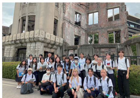
▲昨年度の活動の様子(広島市平和記念公園で)

対4月1日現在で中学生〜30歳の人。定13人。選考あり。料別途必要になる場合あり。