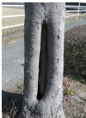
▲幹に空洞がある例

市内の街路樹や公園樹に「キノ コが生えている」「幹に空洞(開口 空洞)がある」「太い枝が折れてい る」などの状態を見かけた場合、 各区役所まちづくり整備課へご連 絡ください。