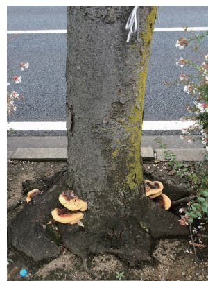
▲根元にベッコウタケが生えている例