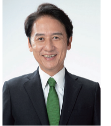
北九州市長 武内 和久