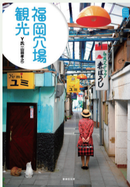
「福岡穴場観光」著/Y氏(山田孝之) 書肆侃侃房