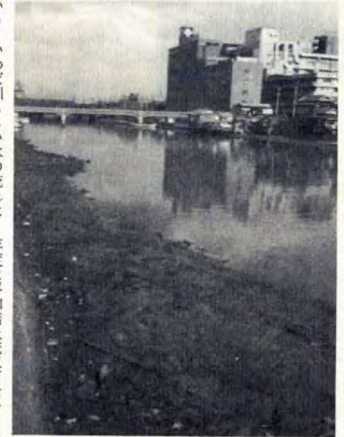
自然の浄化作用もおとろえている紫川

【県土木部へ】 小倉区の紫川は水の流が少なく、汚水や廃水の流れ込みがふえたため、とくに木町の八幡製鉄浄水場から下流のほうは、非常に汚れています。北九州市として、41年度はとくに紫川水系の浄化を積極的にすすめるために、浚せつ、汚染防止、不法占拠住宅の取扱いなど総合対策をたてることにしています。このために40年度中に、県と市で協議会をつくることにしています。協議会がまとまったときには、その予算化を配慮してほしい。なお紫川の貴船橋下流と神嶽川の浚せつはぜひ、41年度に予算措置をしてほしい