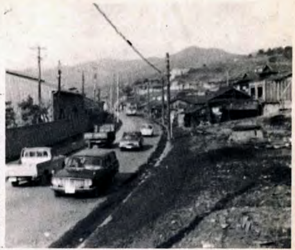
家屋立ち退きがすすむ藤木和 田—宮丸間の和付近

国道一九九号線の区内藤木地区（和田—宮丸間）の拡幅をすすめています。同地区は、道幅を歩道を含め二十メートルにしますが、家屋立ち退きを3月末までに終る予定です。4月からさっそく全面アスファルト舗装工事にかかります。