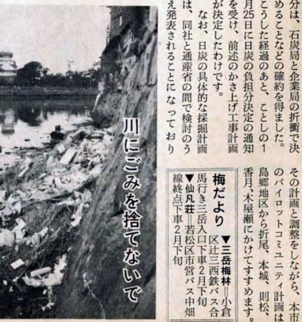
川にごみを捨てないで

分は、石炭局と企業局の折衝で決めることなどの確約を得ました。こうした経過のあと、ことしの1月25日に日炭の負担決定の通知を受け、前述のかさ上げ工事計画が決定したわけです。 ●：小倉区神嶽川が本流の紫川に流れ込む巨過橋付近写真右は、昨年県が約百万円で、泥をさらえ