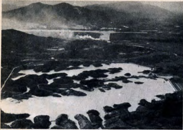
かさ上げて、貯水量が三百万トンふえる 屯田貯水池