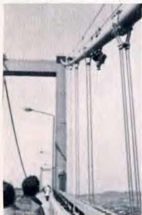
写真 2 メインロープのぬりかえ作業

若戸大橋の化粧直しが行なわれています。3月31日までにメインロープや主塔、戸畑側取付のアプローチなど、全体の約三分の一がぬり替えられます。その費用がなんと約千八百万円。道路公団の話では、当初5年に一回する予定でしたが、パイ煙や亜硫酸ガスのため、汚れやサビが出てきて、真紅の色もすすけた感じになったため、早めたそうです。さらに41年度中に残りの部分がぬり替えられますが、全体の化粧直し費用は約五千万円だそうです。