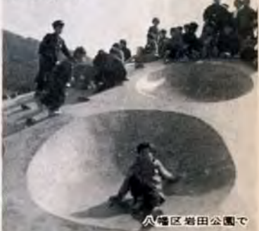
八幡区岩田公園で

子どもたちのしあわせをねがう心は、すべての親にとって共通のねがいですが、地方自治体のしごと(市政)も、子どもをたいせつにすることから始まる赤ちゃんとのおなかの健康診査、妊婦の健康診査、生れてくる子どもを育てるための育児相談、未熟児で生まれた場合は、巡回家庭相談など、赤ちゃんをすくすく育てることから市政は始まります。赤ちゃんから青少年のための市政は、健康を守ること、教育、福祉などの多方面にわたっています。児童福祉の面は大きく分けると一般児童の健全育成、家庭の都合で保育に欠けるカギツ子対策、精神薄弱児童、あるいは身体不自由児童など恵まれない児童への施設、非行児童や問題児への対策の四つに分けるといえます。