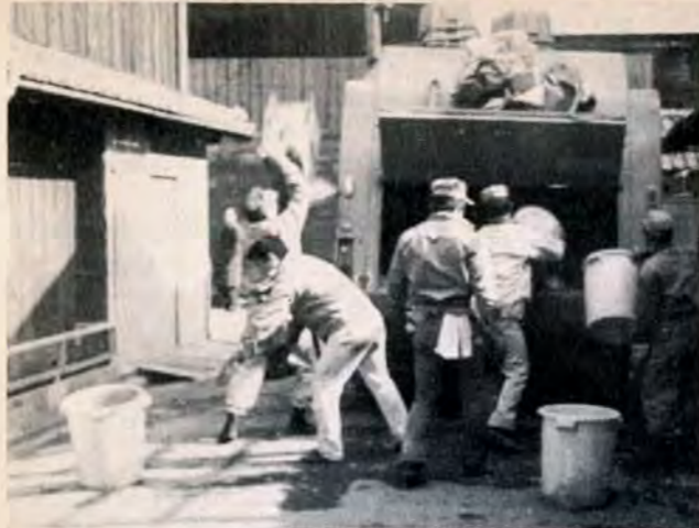
都市の美観を守り衛生的なポリリ容収集を、四十五年までに百%広げます。