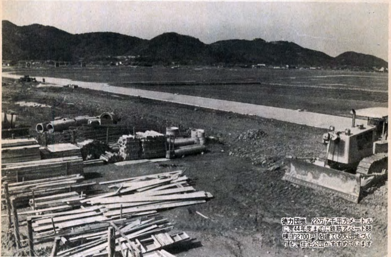
徳力団地 22万7千平方メートルに、44年度までに鉄筋アパート88棟(約2700戸)を建てる大団地づくりを、住宅公団がすすめています