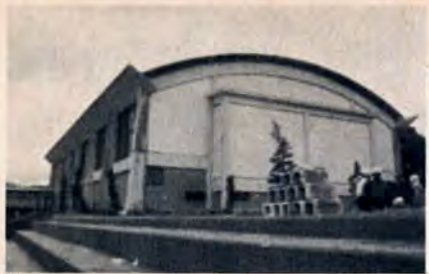
完成した港中学の屋内運動場

小・中学校ではひとりの、ベビームによる教室不足の時期も過ぎ、現在は老朽校舎の改革に力をいれています。毎年、いくつかの学校で、この種の工事をしていきますが、こどもも、4月の新学期までに、つぎの工事が完了する予定です。 ▽小森江東小学校 木造二階建ての老朽校舎一棟を、鉄筋コンクリート4階建て(八教室、のべ約千平方メートル)に改築。3月31日完成の予定。 ▽古城小学校 木造二階建ての校舎一棟を、鉄筋コンクリート4階建てにする工事のうち、3月31日まで一階部分(校長室、職員室など約三百平方メートル)を改築の予定。 ▽港中学校 鉄骨コンクリートの屋内運動場兼講堂(約七百八十平方メートル)を新築。2月26日に完成。 ▽早稲中学校 木造二階建ての校舎一棟を、鉄筋コンクリート4階建て(八教室、のべ約七百三十平方メートル)に改築。3月31日まで完成の予定。 ▽戸上中学校 木造二階建ての校舎一棟を、鉄筋コンクリート4階建てにする工事のうち、3月31日まで二階まで(四教室、のべ約五百四十平方メートル)を改築する予定。 ▽東郷中学校 家庭科教室一棟を新築。3月31日完成の予定。