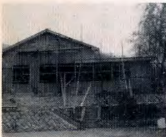
【6月1日から開館します】