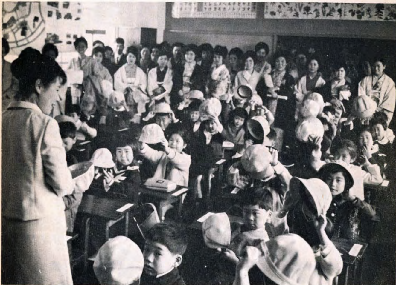
【戸畑区大谷小学校で】

清掃問題についてのお詫び(2、3頁) 特集41年度市予算の概要 …(4、5頁) 土地の固定資産・都市計画税算定方法かわる……(3頁) 貸します就職支度金 …(3頁) 分譲市営住宅あり…(6、7頁)