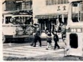
【横断歩道は手をあげて】

▽一回目 4月21日/23日よりの開業医院、4月21日浅川小学校 ▽二回目 5月12日/14日よりの開業医院、5月12日浅川小学校 ▽三回目 6月2日/4日よりの開業医院、6月2日浅川小学校 時間は、開業医院では午後2時から4時まで、浅川小学校では午後2時から3時までです。