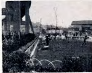
【2千本の緑の木を植えました】

区内宮丸町宮丸公園横に児童館を建設中です。この児童館は、児童の健全育成をはかるための子どもの遊び場、集会所で、カギツ子など留守宅児童の学童保育を行なう施設としても役立っています。同館は、木造平家建てで、集会所、図書室などがあり、6月1日から開館する予定です。工費は約三百万円です。開館後は地元の自治会などで運営委員会をつくり運営します。市では、このような児童館を小学校単位の建設する計画で、毎年2館をつくることにしています。ことしは、若松区宮丸地区と、八幡区香月地区二か所に建設しました。