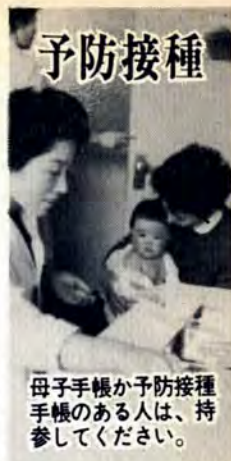
母子手帳か予防接種 手帳のある人は、 参りしてください。