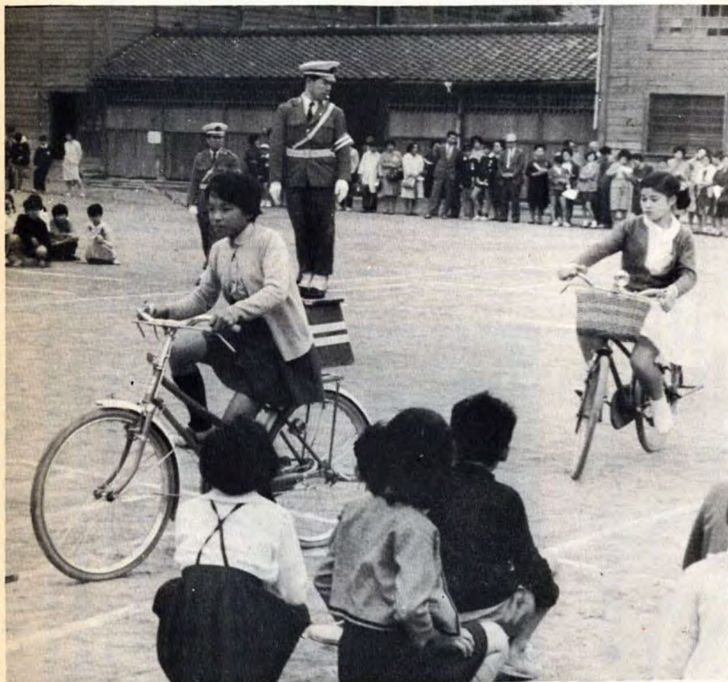
子どもの交通事故 (15歳以下・40年中)