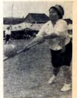
おおかあさんハッスル ムガンバレ...応援席もにぎやか