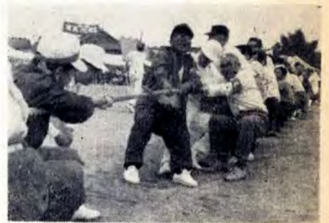
おとうさんも童心にかえってきつなひき

市民プール(戸畑区二枝岩ヶ鼻)の臨時職員、二十歳から二十五歳までの男女十五名を募集します。期間は7月1日~9月10日まで、勤務は午前9時から午後5時まで。希望者は6月18日までに教委戸畑区支所学校教育課1501へ。