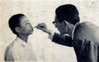
歯の衛生週間4日～10日

母と子のよい歯のコンクールを6月15日午後1時30分から若松文化体育館で開きますが、これに出場する母子を募集します。資格は昭和36年中に生まれた子ども（保育所、幼稚園児を除く）とその母親です。出場希望者は早めに、もよりの歯科医院に申し込みを。