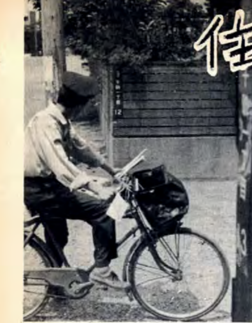
町かどに街区表示板をつけました

戸畑区北部の二平方キロで6月15日から実施します。戸畑区の新住居表示は、北九州市戸畑区〇〇町(町名)〇番(街区符号)〇号(住居番号)という表わしかたをします。