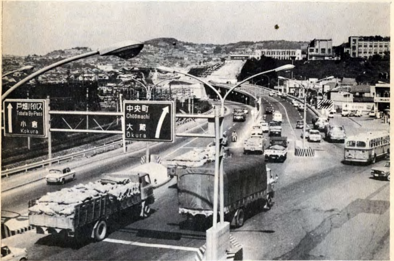
↑八幡区中央町入口