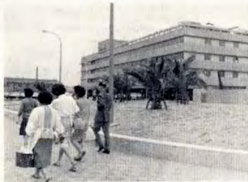
【みどりの芝生にフェニックスが美しい】

戸畑駅前東側に緑の芝生の花壇ができ、通勤する人たちの目を楽しめています。歩道そのの空に、フェニックス十本を植えています。さらに四季の花木を植えます。これは、戸畑駅周辺整備計画によるものです。現在、整備は家屋・工場などの立退きが進んだところからすすめていますが、さらに今年度は、花壇横の家屋立退きを行ない、緑地帯をつくることにしています。将来は、高層ビルなどの建設が予想され、戸畑駅の利用などと合わせて計画します。