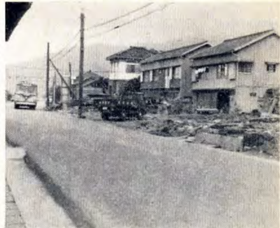
【家屋移転がほぼ終わり、今年度舗装にかかる宮丸地区】

41年度の区内の道路整備計画は土木事業として、国道一九九号線藤木和田―宮丸間など約一千メートルを舗装、失業対策事業として北浜線五三八間など約七千メートルをアスファルト舗装します。