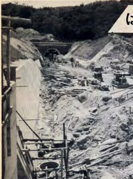
北九州バイパス八幡区河頭山トンネルの工事

本市の新幹線道路として、完成が待たれる「北九州バイパス」は用地買収もほとんど終わり、ルートはほぼ見通しがたったため、道路公団の手で工事に取りかかることになり、7月27日八幡製鉄体育館で起工式を行いました。 3号線ラッシュを緩和 路面電車が走る狭い道路を、タクシー、バスなどにまじって、大型の長距離トラックが走る国道3号線は、市内を東西に横断する唯一の幹線道路です。国道3号線は本来、都市と都市を結ぶ都市連絡道路の性格をもつものですが、現実には、市内道路、街路的な性格を