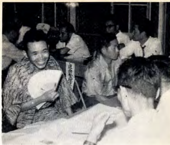
【ゆかたがけで気軽に参加していただきました】

8月の歩こう会 7日(毎週第一日曜日が定例会)午前8時に浅生八幡神社前集合。同神社から一枝経由で金比羅池付近まで歩きます。一般の方の参加を歓迎。