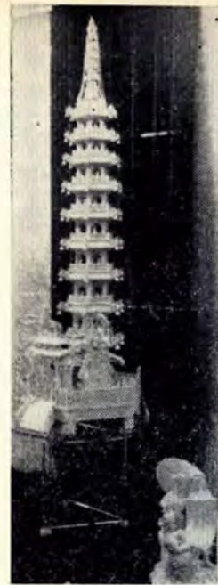
一人で一年以上かけて彫った象牙の塔