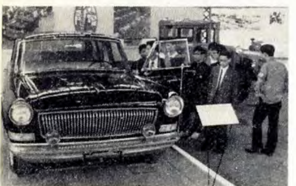
邦価150万円、8人乗り最高時速160kmの高級車

手・工芸品は、さすがに伝統をほころぶだけに出品種類もいちはば多く、目のさめるような色彩、精巧な技術製品が約一千点あります。じゅうたん、絹織物、毛糸しゅうには万里の長城のほか、富士山を描いたものもあり、日本に対する友好の心情が感じられます。