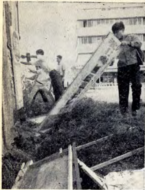
違反広告物を撤去する作業員（戸畑駅前）