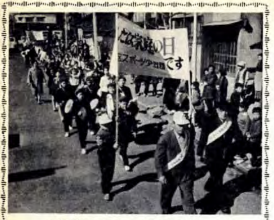
家庭の日・10月16日 あしたは家庭の日です。一家そろって楽しく過ごしましょう。と鼓笛隊を先頭に、よい子と世話役さんのパレードです。門司区古城校区では、毎月「家庭の日」の前日にスポーツ少年団員や青少年育成協議会役員のみなさんが、区内の人々に呼びかけているもので、ことしの3月から続けられています。

出物 見流し館 五条の大橋 三国志 おはなはん 南極基地 堀川館の夜討 勧進帳・安宅の関 水滸伝 巖流島 雀のお宿 桃太郎 清水寺 花咲爺など22景 演芸館 グランドレビュー「翼に乗って」全14景 菊花壇 大輪 中輪 盆裁 懸崖 細工作りなど 西日本菊花コンクール特設菊栽培教室の開設 入場料 高校生以上200円(前売券160円) 小中学生100円 幼児20円