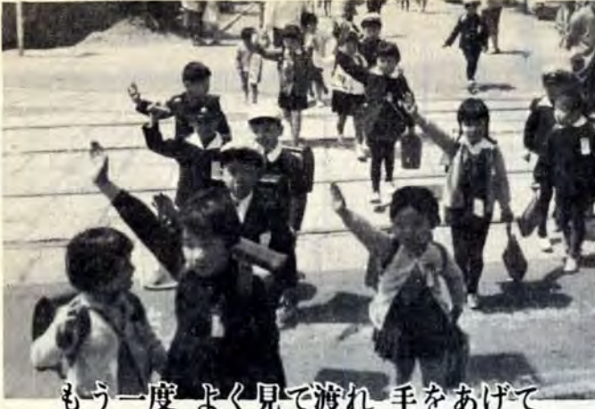
もう一度よく見て渡れ手をあげて 20日まで 秋の交通安全運動 全国の交通事故による死者が1万人をこえ、史上最高というありがたい記録です。これ以上記録を伸ばさないために、あなたもわたしも、交通道徳を守り、尊い生命を守りましょう。

41年度は、まず三千六百万円で、小倉馬場公園付近三百六十メートルをはじめ、国道一九九号線折尾段道六十四号、八幡区平野町五百九十号などに歩道を設置します。 道路照明は、自動車交通量の多い国道一九九号線を中心に、ナトリウム灯四百四十ワットを六十三基、このほか車の転落防止用ガードレールのべ三千八百基、視線誘導標識千七百八十八基、道路標識八十九基、道路反射鏡八本などを設置します。 さらに42年度は六千二百万円、43年度は一億八千六百万円の事業費で、学童用陸橋七か所、交差点改良などを計画しています。設置、改良の場所は警察などと話し合います。