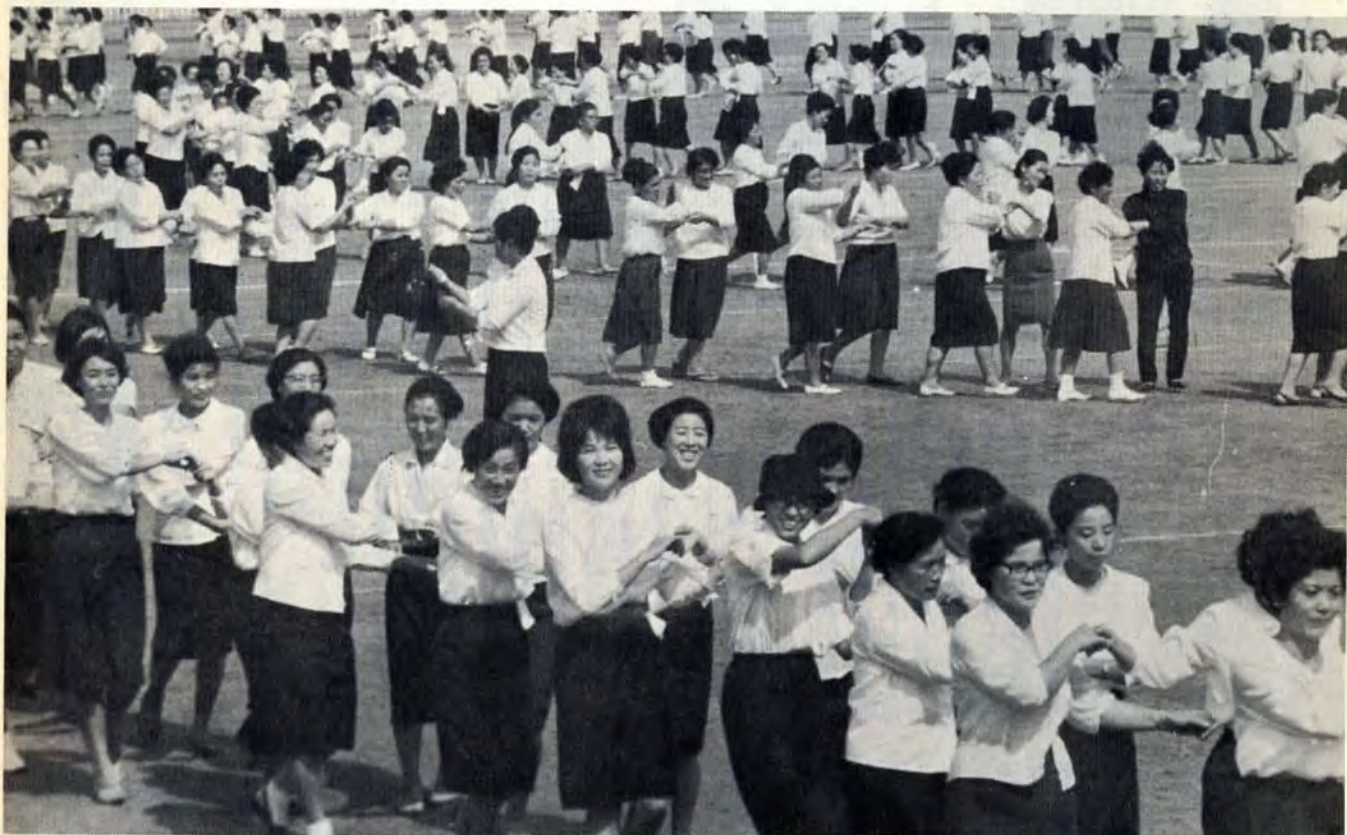
婦人会員のフォークダンス

赤い羽根は隣人愛のシンボルです。恵まれないおとしよりや子ども、社会福祉施設にはいている人々に、暖かいお正月を迎えていただくために、あなたの胸にも赤い羽根を飾ってください。