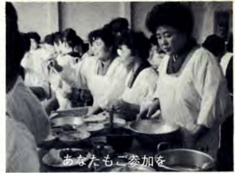
あなたもご参加を

みなさんの健康を増進し、明るく楽しい暮らしをするために、生活の改善に努めましょう。区ではつぎの日程で栄養改善料理講習会を開きます。対象は一般婦人。受講希望者は当日会場へ。無料。 講習内容は、講話「胃ガンと食生活について」、料理実習「牛乳入り味噌汁、ひき肉ボールのクリム煮、洋風すいとん」など。材料器具は持参しなくても結構です。 時間は午後1時30分～3時30分 場所は対象地区。 ▽10月17日 曾根公民館(曾根・貴・葛原・朽網・吉田) ▽19日 黒住町公民館(寿山・霧ヶ丘・足原) ▽20日 清水公民館(清水一・清水二) ▽21日 中島公民館(住吉町(中島・天神島・貴船)) ▽24日 北方公民館(水神町(北方・徳力・志井・横代・城野)) ▽25日 勤労青少年ホーム(小倉城西采町・堺町) ▽26日 中井校区婦人公民館(錦ヶ丘(日明・中井・西小倉)) ▽26日 下富野公民館(昭ヶ丘(桜ヶ丘・富野)) ▽11月9日 到津公民館(下到津電停前(到津・泉台・井堀)) ▽11日 足立公民館(中津口三丁目(足立・三郎丸)) ▽16日 東谷公民館(市丸・新道寺) ▽18日 両谷公民館(長行・合馬・道原・山本・頂吉)