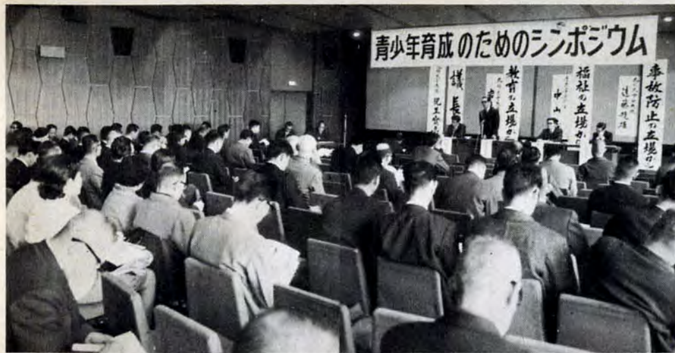
青少年の健全育成のため積極的施策をどう進めるか—12月6日小倉区新小倉ビルで、市と教育委員会共催で「青少年