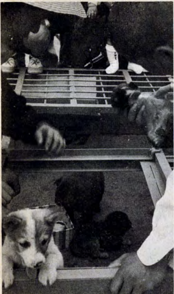
責任もって飼ってほしいワンノ (交換市で)