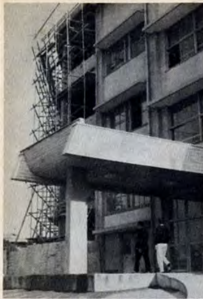
普通教室3室を増設中の戸畑中学校

小中学校の施設整備は、古くなく木造校舎の改築や生徒増加による増築などを逐次行なっています。現在、浅生小学校では校舎改築、戸畑中学校では増築工事中です。浅生小学校は、木造校舎を鉄筋コンクリート四階建て十教室に改築しています。戸畑中学校で