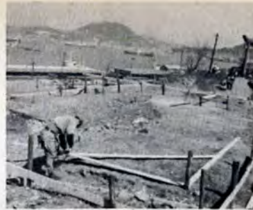
↑海の見える高台で工事を始めました

区内白木崎の金比羅神社下に、門司区では初めての児童館を建設します。この児童館は、子どもの健全な遊び場、集会所として利用し、あるいは、カギっ子など留守家庭児童の学童保育を行なう施設としても、たいへん役立ちます。関門港を見おろす高台に、建物面積二百平方尺、木造二階建ての子どもの社交場が完成するのは5月末の予定です。工事費は約三百八十万円です。 このほか、八幡区香月、若松区藤ノ木、小倉区長浜には、すでに児童館が完成しており、小倉区若園町でも工事を始めました。