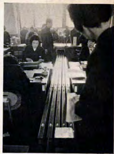
1分間50秒で書類を運ぶ

八幡区役所に続いて小倉区役所市民課にも書類を運ぶベルトコンベヤーがお目見え。しごと始めの1月5日から活躍しています。ベルトは1分間50秒の速さで書類をのせて走ります。これで印鑑証明や戸籍謄本の持ち歩きが解消し、受付にはいつも職員がおり、受付けでお待ちいただく時間は、ぐっと短くなります。工費は約410万円。また、待合室も2月中旬ごろまでに拡張します。