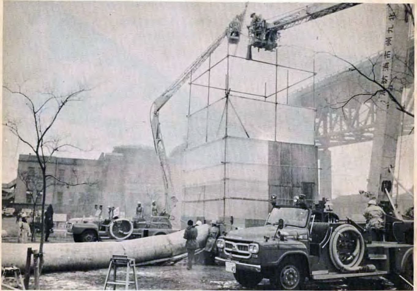
若松区役所前広場で