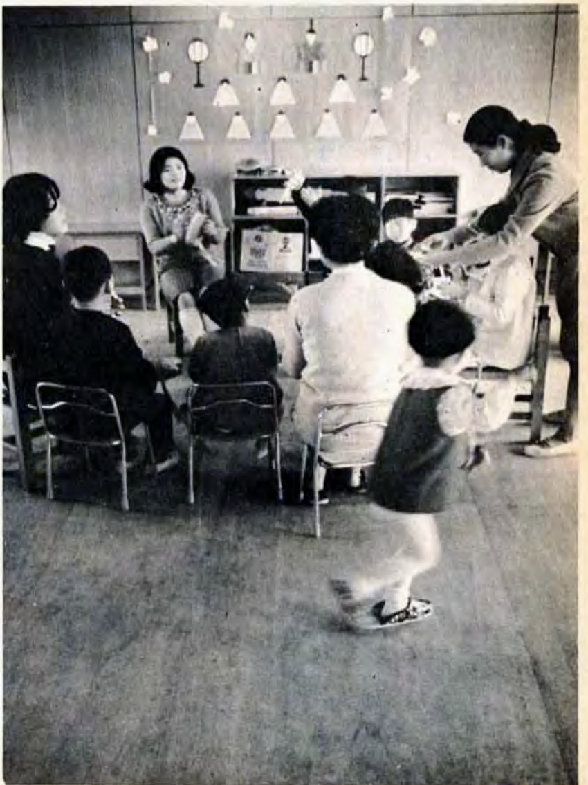
おかあさんから離れ、先生方と楽しく遊ぶなかで、自立の精神を養う。 (小倉区ひまわり学園内、せいなん母子学級で)

養護母子学級は、市内に4か所あります。小学校に入学する前の知恵おくれのお子さん(3歳~6歳)を対象にし、週2回、おかあさんと、いっしょに自立のための生活指導をしています。 知恵おくれのお子さんは、どうしても過保護になりがち。そこで、ここでは、まず、おかあさんから離れて生活させることを第一の目的としており、回復がよければ、普通の学校の特殊学級にはいれる程度にまでなります。また、お子さんの指導ばかりではなく、おかあさんにも、別の部屋で、家庭での育て方などの指導を合わせて行なうという、ユニークなもので、北九州市が他市に先きがけて、42年に設置したものです。現在、全国に11か所しかありません。 【重度の幼児には】 ▶おだ学級=市児童相談所内(八幡区尾倉町4)定員は10人。 【中・軽度の幼児には】 ▶せいなん学級=小倉区ひまわり学園内 ▶こひつじ学級=八幡区銀星幼稚園内。 ▶光の子学級=門司区門司幼稚園内。定員はいずれも12人です。