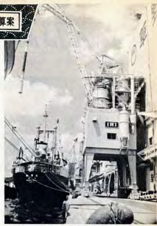
新鋭機械によって荷役を高速化(門司新浜埠頭)