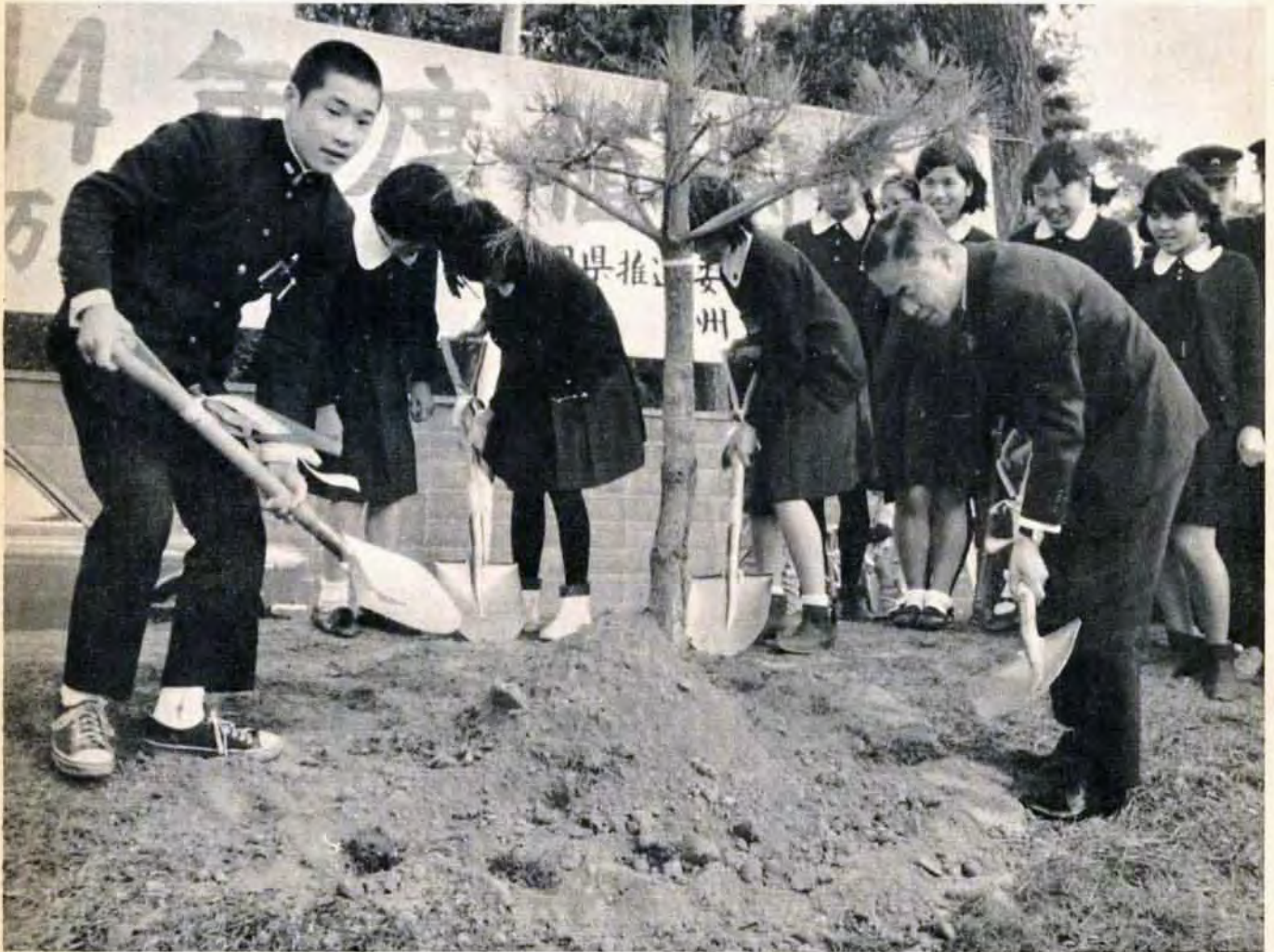
戸畑区明治学園前での植樹祭