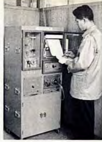
子局のテレメーター

ランブは汚染程度によって白(〇・一五P)PM未満、緑(〇・二)PPM未満(赤(〇・二)PPM以上)とかわり、汚染の状態が一目でわかります。監視センターでは、このランブの状態と自動記録計器に表われた数字などをもとにして、スモッグ注意報や警報の発令をきめます。