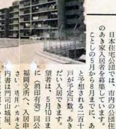
3月完成した新居住者の住宅

市営住宅も敷地難の例にもれませんが、このため市住宅供給公社を通じて、用地の先行取得に努めています。45年度の市営住宅建設費二十九億円のうち二〇%が用地取得費という現状です。こうした事情から、老朽木造団地の中層アパート化に力を入れていきます。