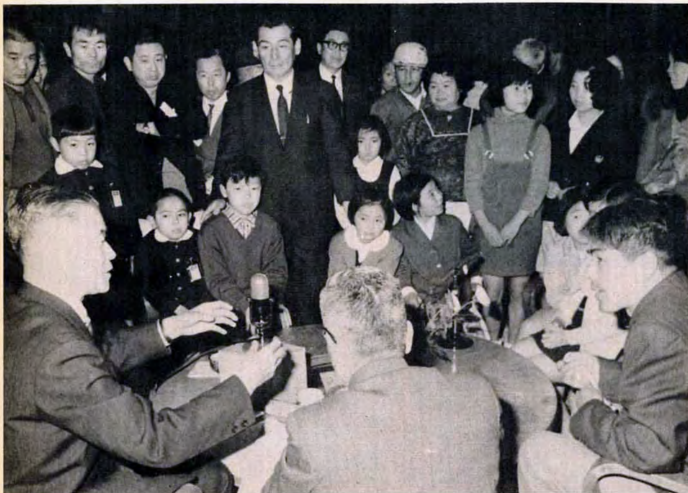
こども会も市長に要望 (小倉区古船場の菅原神社境内で)