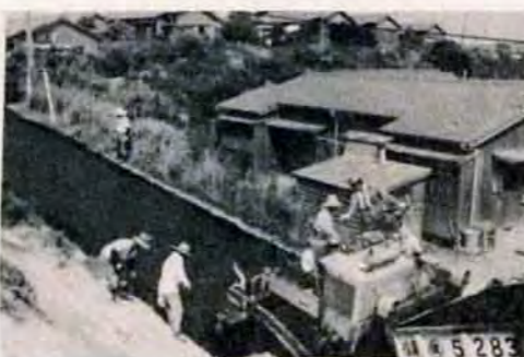
団地内の道路も、45年度でほぼ舗装が終る

マイホームローンの建設や購入、貸アパート、従業員住宅の建設などに、市が融資するマイホームローンは、45年度千二百戸分(十億円)を用意して、みなさん利用を待っています。本年度は、住宅金融公庫以外の公的資金を借りて建てる場合にお貸しするほか、一部償還期間をくり延べるなど改正しています。希望者は、区役所市民相談室住宅係(市建築局指導課)戸畑区鳥旗町87局7061へどうぞ。【住宅防災相談】 雨期をひかえて、市防災月間として、住宅のガケくずれ土砂流出の防止のための改善指導を重点的に行なうことになりました。石垣や排水こうなどの防災相談も、つきのことろでお受けします。無料。【戸畑区】 沢見・西戸畑 市市民相談室 △7日 小倉区市民相談室 △11日 若松区市民相談室 △12日 戸畑区市民相談室 △13日 八幡区市民相談室