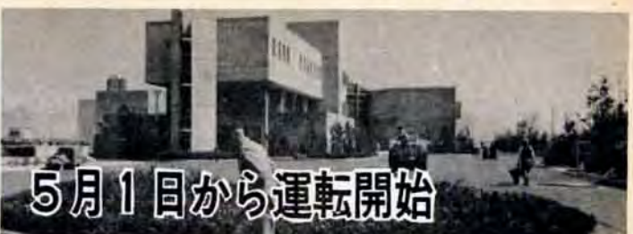
5月1日から運転開始

不買犬 犬の買上げは、毎日午前中保健所で行なっていますが、出張買上げもします。ご利用ください。成犬、子犬とも一頭二百円。印かんをお忘れなく。