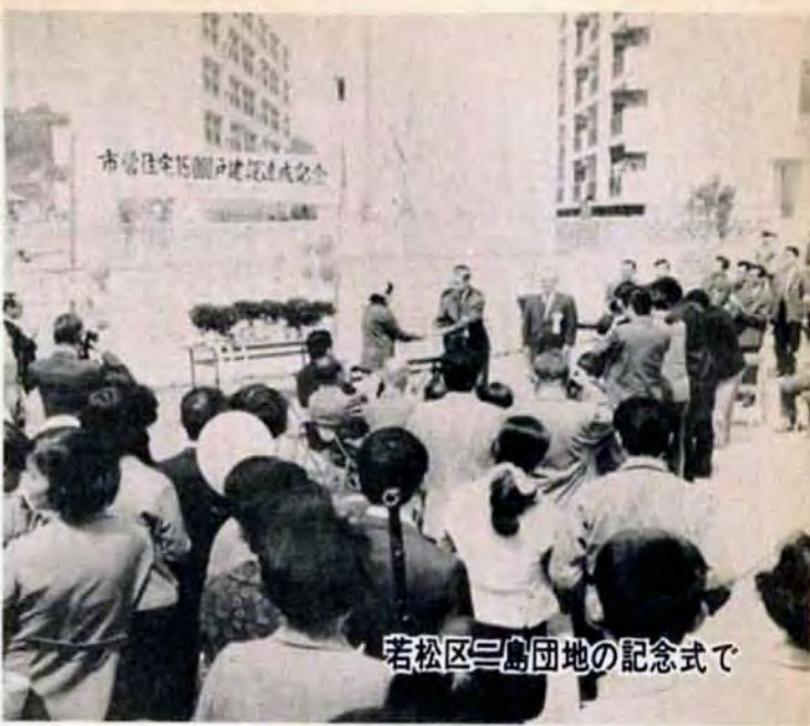
若松区三島団地の記念式