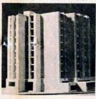
戸建設する11階建ての模型

この値上りを反映したものであり、職住接近という新たな要望にこたえるためでもあります。市街地再開発の面からも、今後こうした高層化はかなり必要になってくることでしょう。すでに39年度から木造平家の建設は全廃しています。五階建ての中層アパートの建設は、全建設戸の値上りを反映したものであり、職住接近という新たな要望にこたえるためでもあります。市街地再開発の面からも、今後こうした高層化はかなり必要になってくることでしょう。