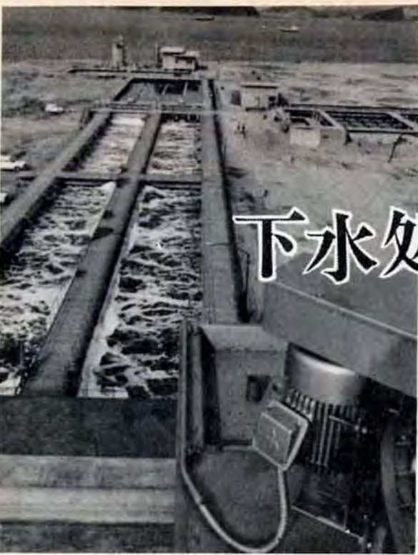
完成した、ばつ気槽

日明下水終末処理場は、戸畑・小倉・八幡区槻田地区から出る下水を処理するため、43年8月から総工費十五億円をかけ、広大な小倉区日明埋立地の一角（七万九千平方メートル）に建設を進めてきました。こんど完成したのは、全体計画の約八分の一。処理場の全機能を 市では、きれいな町づくり、に欠かせない下水処理場の建設や下水管の敷設工事など、水質改善のための工事を着々と進めています。このほど、そのうちのひとつである「日明下水終末処理場」の一部が、小倉区の日明埋立地の一角に完成し稼働を始めた。同処理場は、42年から本市が百四十億円を投じて進めている「下水道整備五か年計画」の中心となる施設です。これにさらに整備を進め、最終的には、五十六万六千人分の下水を処理する西日本最大の処理場となります。 まず、戸畑区の半分を処理 集中管理する管理センター（鉄筋コンクリート三階建）をはじめ、ばつ気槽、最終沈殿池、汚泥処理施設などの処理機能を備えたもので、すでに戸畑区内に敷設している下水道管と接続し5月1日から運転を開始します。この完成で戸畑区の約半分（七万一千人分）の家庭が水洗化でき、台所の汚水も、ここで浄化されます。 西日本最大の下水処理場へ 同処理場は、本市の下水処理場としては、八幡区の皇后崎処理場（二十四万六千人分を処理）に次いで二番目のもの。こんど、戸畑区の残り全域と、小倉区（曾根地区を除く）全域、八幡区槻田地区の下水が処理できるようさらに整備を進め、46年度末には、約二十八万人分を処理し、最終的には、五十六万六千人分、一日二十二万トンの処理能力をもつ西日本最大の下水終末処理場になります。