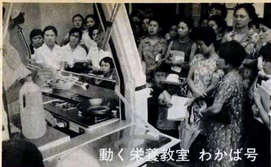
動く栄養教室 わかば号