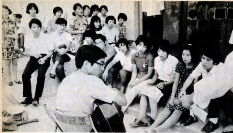
他のグループとの交歓で、青年たちは友情の輪をひろげる