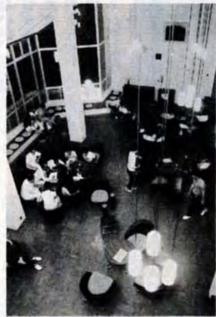
デラックスな談話室

小 鳥の声とともに、朝六時半の起床にはじまり、夜十時半の消灯まで研修目的をもったグループが、「青年の生き方」「青少年団体の運営」などの話し合いや、体育、レクリエーションを行ないます。この特徴は、勤労青少年ホームや地域の公民館などと異なり、宿泊しながら共同生活していること、研修やレクリエーションの専門指導員がいて、司会のコツやゲームなど、研修目的にそって実地に指導、助言を行なっていることです。