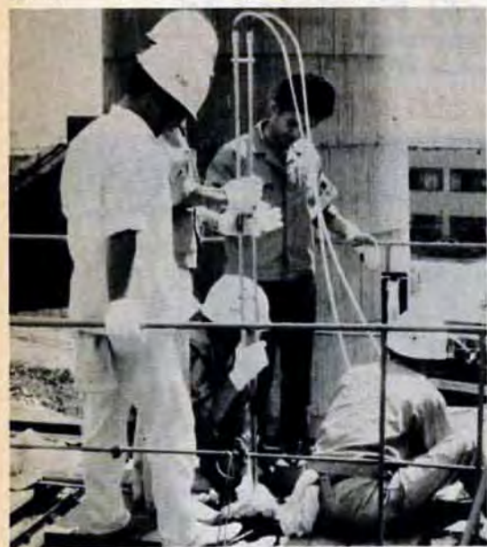
煙突の排気ガス立入り測定

その結果、三十一企業では、10月1日からスモッグがひどくなるときの自主的に亜硫酸ガスの排出規制を、これまでより一〇%上積みすることにしました。