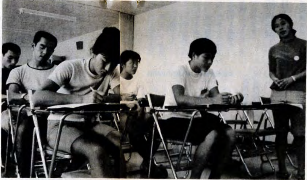
きちんと並んだ机とイスー 学生助がなつかしい 利用者の希望があれば講師のあっせんもする

開館以来五か月で早くも一万六千人が利用する盛況ぶりです。午前中は各グループ独自のプログラムに従っての講義、午後は体育館や屋外で他のグループと友好を深めながら、ゲームやスポーツを楽しんでいます。