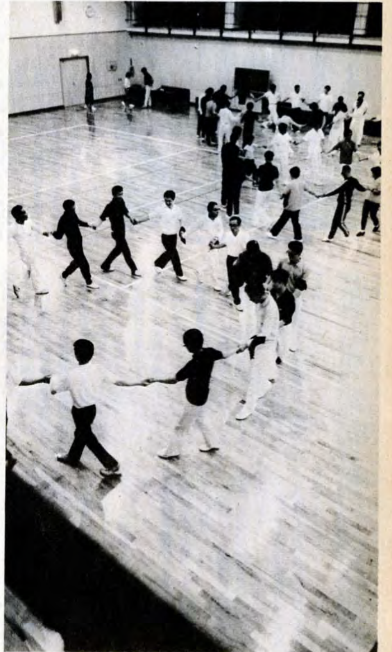
木の香も新しい750平方の体育館で思い切りハネをひろげる

【利用方法】 対象は、市内に住んでいるか勤めている小学五年生から二十五歳までの青少年で、研修の目的をもった学生、中小企業に働く若者など五人以上のグループ。青少年団体関係者も使用できます。食費と寝具(シーツ)洗たく代以外は無料です。申込みは、あらかじめ青年の家(若松区大字竹並、79局1801)へ定員に余裕があるかどうかを確かめ、そのあと申請書と参加者名簿をそえて申し込んでください。毎週月曜日と祝日は休みです。