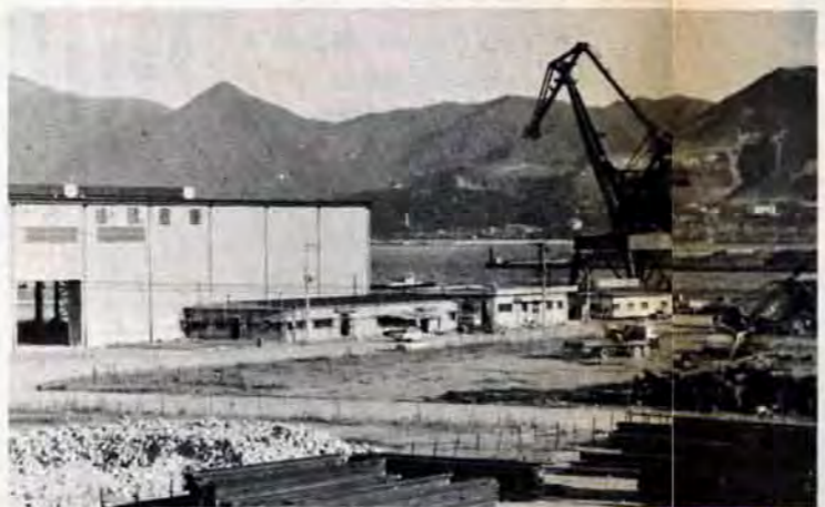
↑ことし12月から活動する日明鉄鋼埠頭。上屋12,500平方メートル、35トン吊りの大型クレーンが2基つき、年間60万トンの鉄鋼やその他の重荷を扱います。

変革する北九州港 こうしたことから、北九州港管理組合では、いま大型船などの受け入れ態勢を整えることに努めています。45年度のおもな事業は、門司区田野浦コンテナターミナル建設(来春から使用開始)太刀ノ浦埠頭の造成(昭和50年に完成)小倉区日明埠頭の鉄鋼専用埠頭建設(ことし12月から使用開始)、若松区豊瀬埠頭の貯木場(来春から水面貯木を開始)づくりなどです。