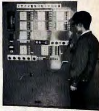
中央局↑ 写真の警報同報装置は中央局のボタンを押すと子局のランプが付き、スピーカーで燃料切り替えを要請します。