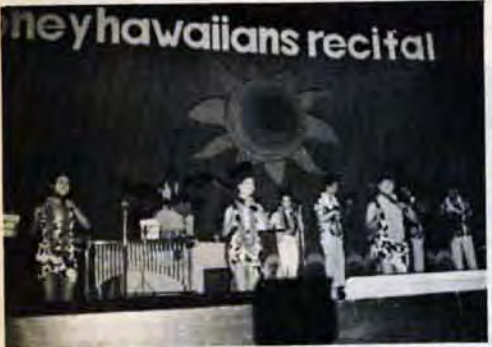
23年間も続く定期演奏会

新日本製鉄ハニーハワイアンズ (音楽、昭和22年結成団員15名)…創立以来23年間、社内はもちろん、北九州あるいは九州地区内で毎年定期演奏会を開き、刑務所慰問など意欲的な活動で、北九州軽音楽界の進歩向上に多大の貢献をしました。