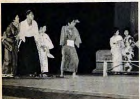
無法松の一生の公演場面

劇団青春座 (芸能、昭和20年結成、団員32人)…戦後の荒廃した中で旗あげ以来火野葦平伝、無法松の一生、小倉城に生きた野郎共、筑豊一代などつねに郷土に密着したテーマと人物像に取組み、芸術的良心と高度の技術を持って、北九州演劇界文化界をリード、こんごの活躍が期待されています。