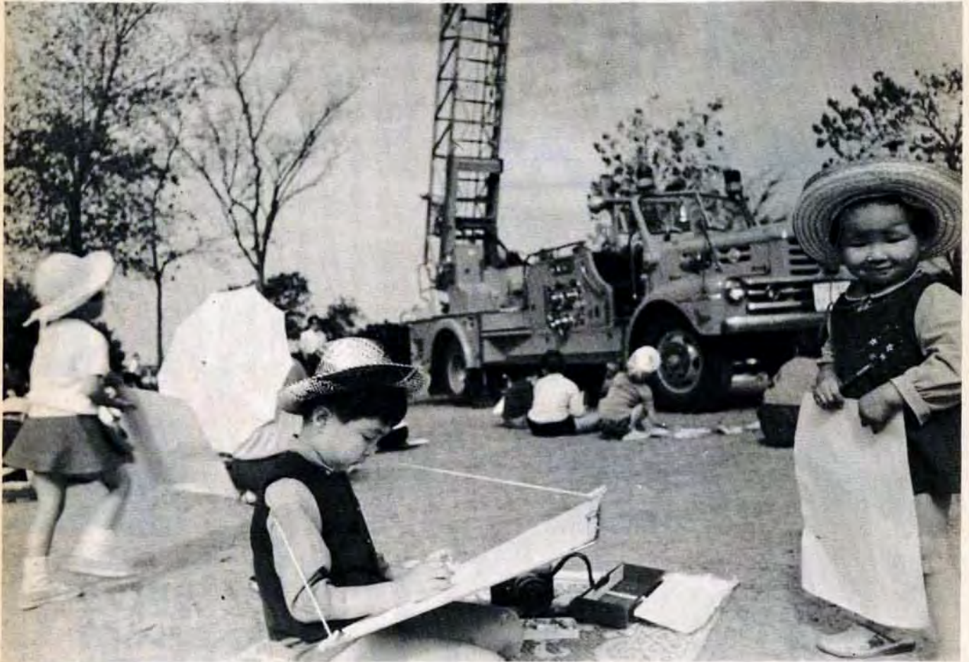
八幡区桃園公園で