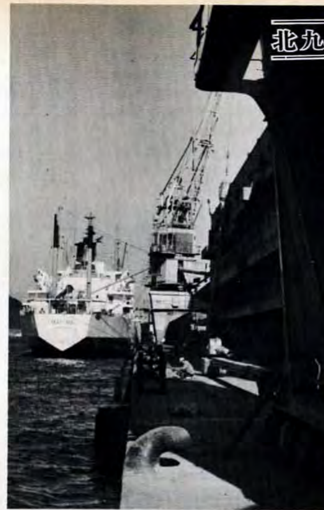
↑機械化された門司港西海岸岸壁。穀物肥料などの専用岸壁では人手を取らずに立体倉庫に荷上げされます。

西日本最大の貿易港として躍進をつづける北九州港は、現在全国第四位の貨物取扱量を誇っています。戦後、大陸貿易が衰えたため一時的な停滞が起りましたが、いまでは、九州、山口地区外国貿易貨物の八十%(二千八百万トン)以上をまかなうまで大きく成長しました。これは、地理的優位性に加えて、港湾施設の改善拡充や近代化の努力が実ったものです。