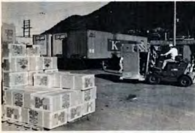
上は来春から活動する田野浦コンテナ基地。35トン吊りの大型クレーンが1基つき電器、ゴム、陶磁器などの雑貨を年間40万トンあつかいます。左は門司港10号岸壁の仮コンテナ基地

変革する北九州港 こうしたことから、北九州港管理組合では、いま大型船などの受け入れ態勢を整えることに努めています。45年度のおもな事業は、門司区田野浦コンテナターミナル建設(来春から使用開始)太刀ノ浦埠頭の造成(昭和50年に完成)小倉区日明埠頭の鉄鋼専用埠頭建設(ことし12月から使用開始)、若松区豊瀬埠頭の貯木場(来春から水面貯木を開始)づくりなどです。