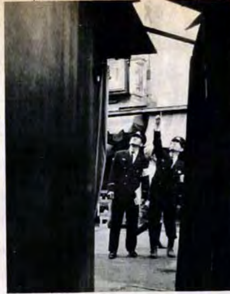
家庭防火診断をする消防職員。