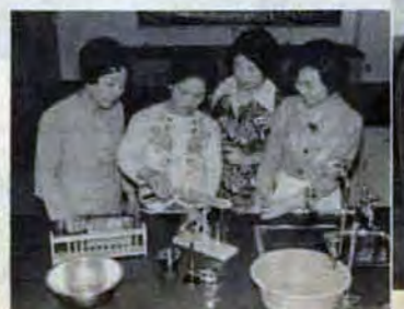
△実験実習室…主婦の手で商品を試験し、成分が判別できます。