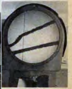
△万能投影機…毛糸のもつれ、ねじれなどが一目でわかる。