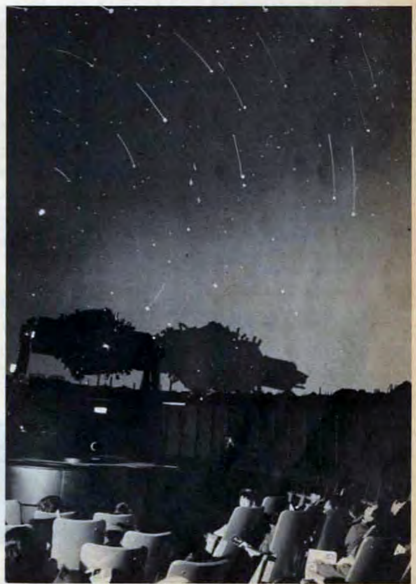
六千個の星を映しだすプラネタリウム。全天体の複雑な動きを再現します

新しい時代にマッチした秩序ある町づくりをすすめるため、計画的に家を建てていく区域(市街化区域)と、当分は家を建てるのを見合わせる区域(市街化調整区域)とに分けることをすすめてきました。このほどこの作業が終わり、昨年12月28日づけで決定告示(県知事)されました。今回は、この決定と同時に適用される開発許可制度についてお知らせします。