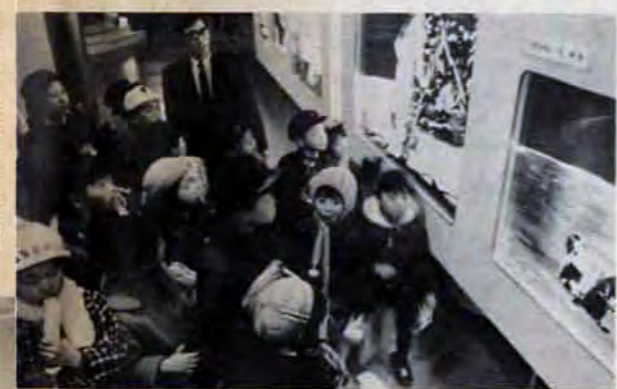
宇宙をわかりやすく説明したパネルがいっぱい

▽プラネタリウム開演時間：9時45分、11時、13時30分、15時、16時15分。一日五回で一回は45分間。 ▽入館料：小学生50円、中学生70円、高校生70円。おとな百円。小中学生の学習計画による利用は無料。団体割引あり。 ▽休館日：第一・三・五日曜と第二・四日曜。