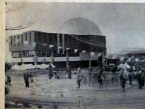
宇宙科学館の全景。右は児童文化センター