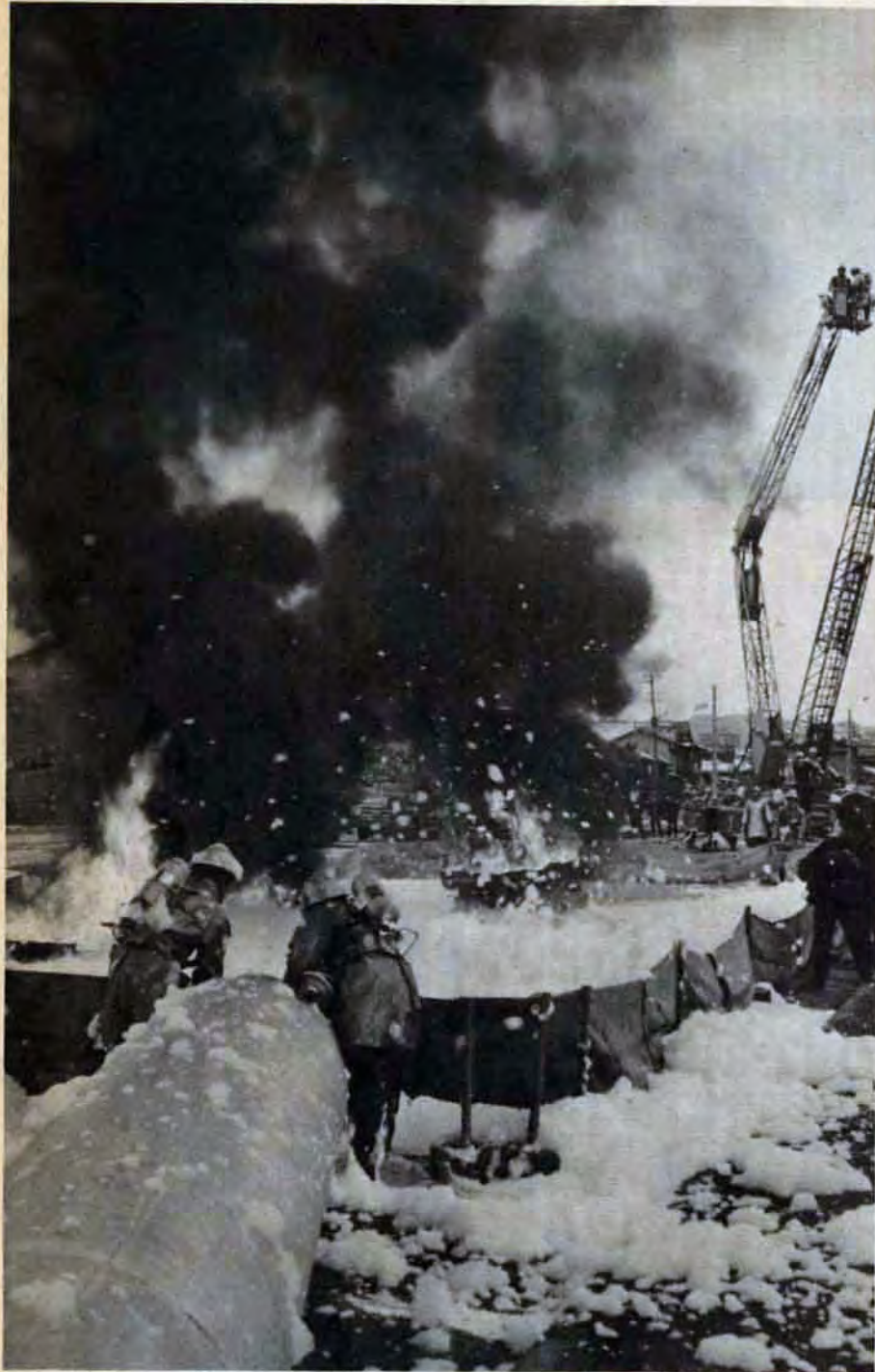
戸畑文化ホール前で

(や)りであったものが、いまでは化学時代にふさわしく、銀色の耐熱服がキビキビと動きます。出ぞめ式は、近代的なビル火災を想定し、高発泡装置のほかスノーケル車やはしご車も出動、その威容や日頃の訓練をひろうしました。