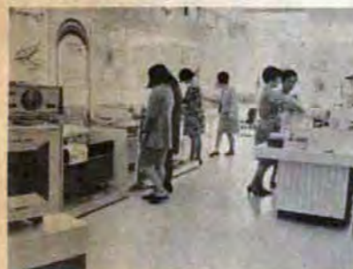
△展示コーナー…商品知識をパネルで