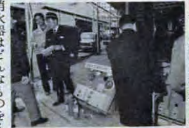
消防局では昨年暮れ、電気、ガス、石油会社の協力によって市内十か所で街頭消防相談所を開きました。期間中約五百件の相談がありました。

がんセンター専用の病棟づくりはじまる 市立小倉病院に併設されているがんセンターの増築工事が、12月28日から始まりました。総工費一億三千万円で、地上三階地下一階の現施設の上に四階と五階を増築し百床のがんセンター専用病棟をつくらうというも