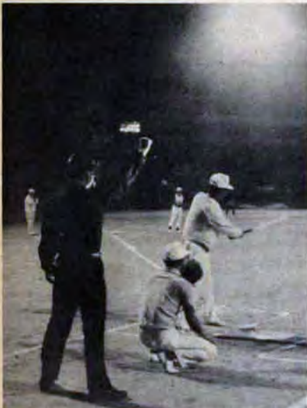
ナイター施設...若松市民グラウンド他2か所に

と幼児用プールを新設します。勝山市民プールと和布刈塩水プールにすべり台をつけます。また、学校プールは昨年までに小中学校百七十二校のうち用地がないなど特殊の六校を除く百六十六校につけましたが、ことしは小倉区三郎丸小、戸畑区浅生中に新設し防火用水池程度だった六校のプールを改修します。これらの費用は一億二千八百万円。 夜間照明 としては三か所に昨年、門司テニスコート、勝山市民プール、高畑台野球場、浅生球場に取りつけた夜間照明設備が好評だったので、ことしは門司区老松野球場、小倉区三萩野ベビー球場、若松区市民グラウンドに取りつけます。予算は三千八百万円。 小倉、八幡の勤労青少年ホーム二か所、公民館二か所、市民会館の小集会室四か所、玄海青年の家にそれぞれ冷暖房設備を取りつけます。