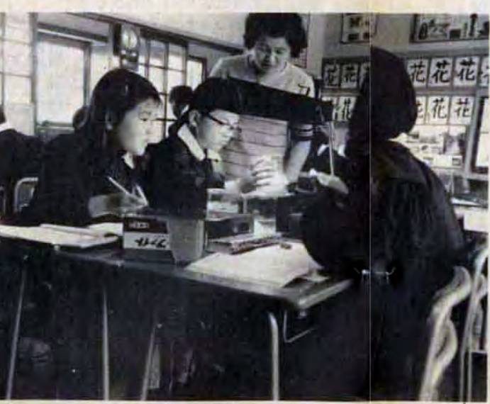
普通教室では照明器具を持ち込んで