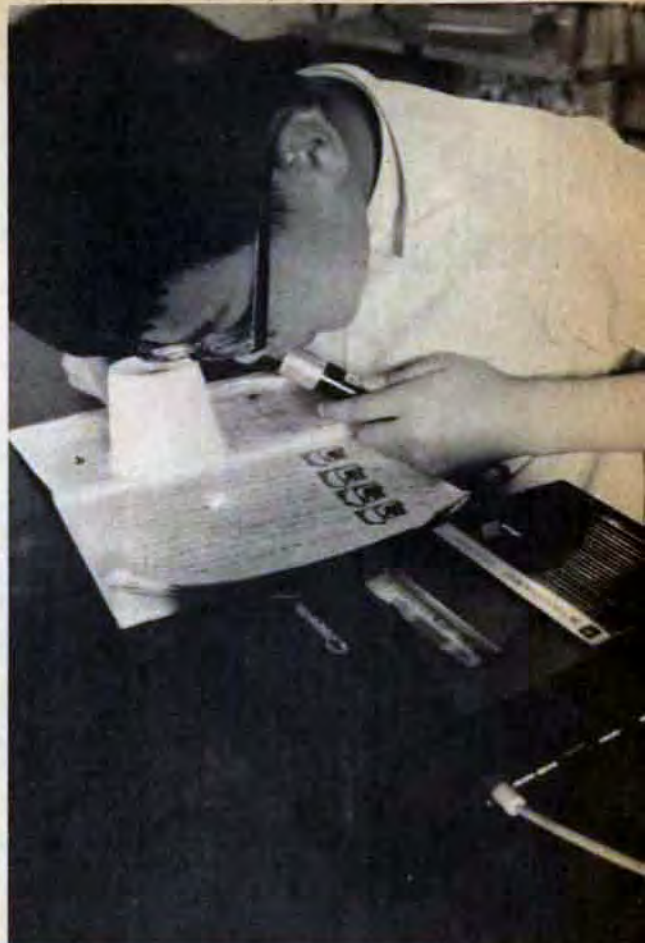
九か月たった弱視学級へ天籟寺小学校