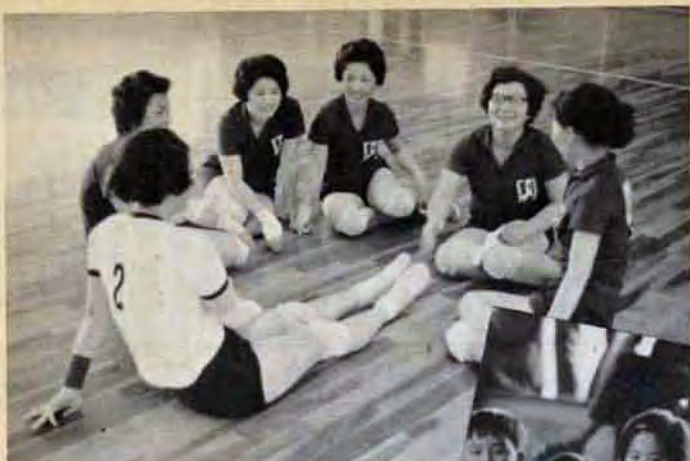
↑心地よい疲れ—忘れていた青春がふつふつとよみがえる (小倉体育館で)