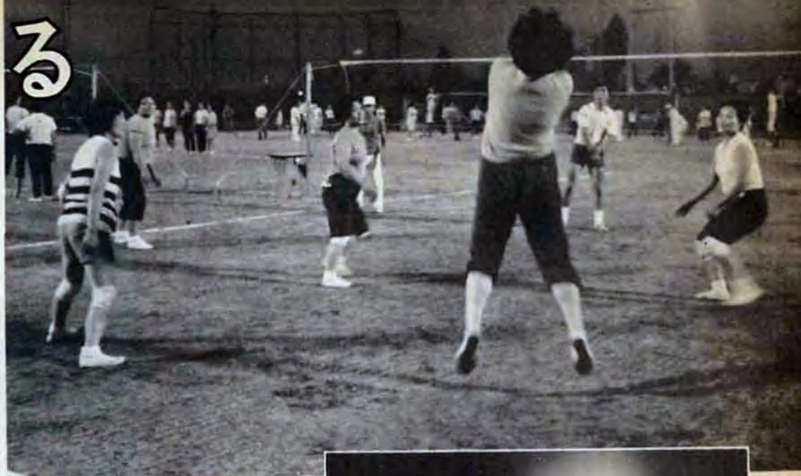
カクテル光線を浴びて涼しいナイター