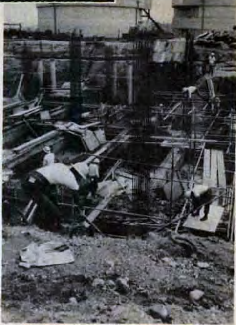
47年運転開始をめざす門司新町処理場