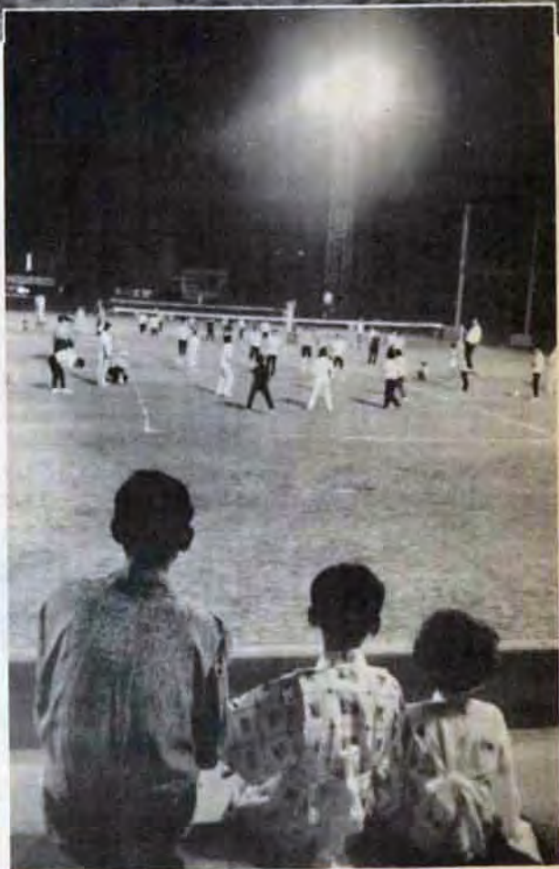
「かあさん馬力あるネ」とゆかたがけの応援席 (浅生球場で)

テレビのナイター中継にかじりつくパパを尻目に、こちらのナイターはママさんたちが主役——。日ごろ、控え目なママも、ボールを追っかけて、子どものように大はしやぎ。昨年からはまったレクリエーション・バレエ。スパイクなし、アンダーサーブ、といった本独自クのやさしいルールで、初めて——。 ひと汗流したある奥さん「気分がハッラツとしてきます。主人や子どものことも忘れちゃって……と、家庭婦人の運動不足解消を目ざしたこのスポーツ、愛好者はしだいにふえているようです。