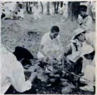
＜小倉・森林公園で＞