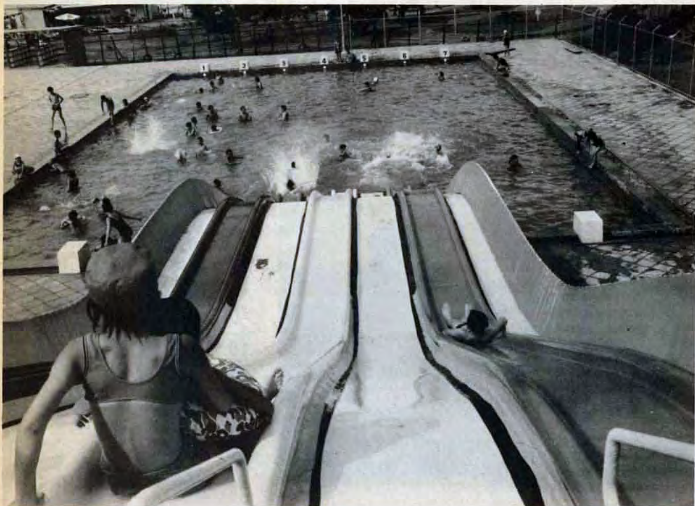
門司区めかり塩水プールで