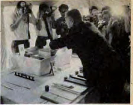
タイム・カプセルに市政だよりなどを収納