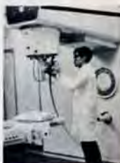
感電に注意 リカカニ カカニ

区内に住む三十五歳以上の婦人が対象。学診希望者は8月9日から28日までの間に、小倉保健所または城野保健所へお申し込みください。定員は両保健所とも各千人。検診は、8月23日～9月3日(土・日曜を除く)、つぎの医療機関で行なわれます。検診料は五百円。受診の際、医療機関に支払ってください。