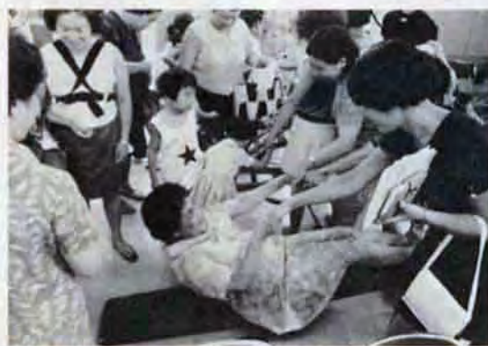
あなたもヤセられる—とあっていやがうえにもハッスル(戸畑区のやせよう会で)