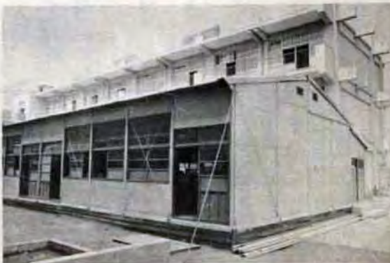
ドーナツ現象で生徒がふえ、プレハブ教室で勉強(八幡区沖田中)

備するとともに、雨天のときでも運動ができるよう屋内体育館の建設をしています。 現在、屋内体育館は土地がないなどの理由で二、三の学校を除くほかは、ほとんど充足しています。まだ設置していないところは、46年度中に土地買収などをして建設していきます。