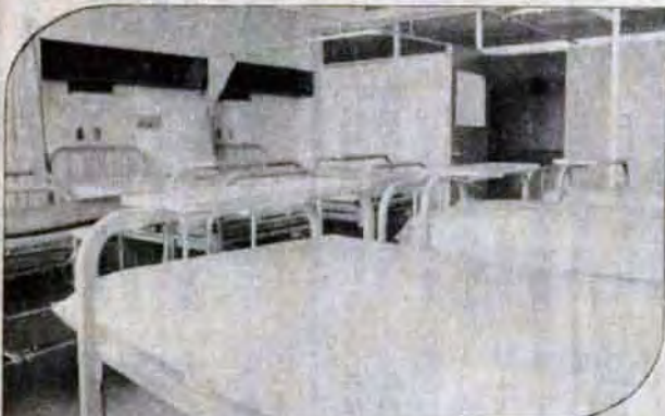
▲これまで、小倉病院のベッドを使用していたが、10月に専用病棟(4、5階)を増設し、百ベッドを備えました