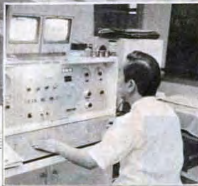
遠隔装置でテレビカメラを見ながら照射をする