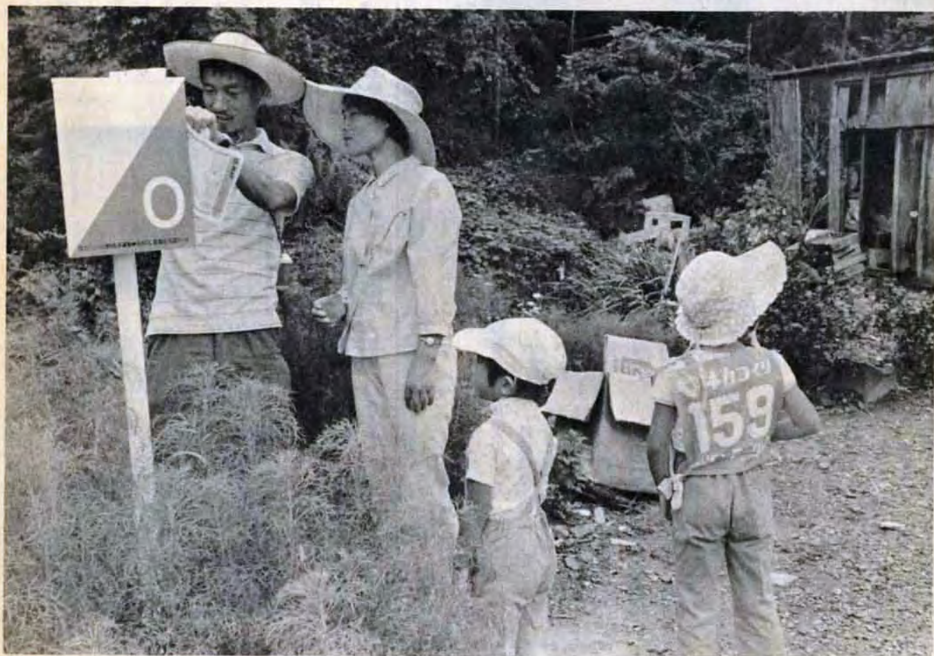
9月19日玄海青年の家モデルコース第1ポイントでの親子チーム