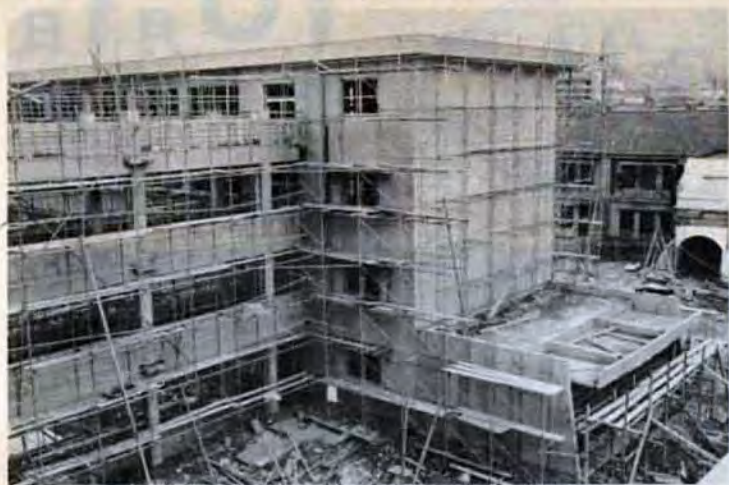
古い校舎を鉄筋校舎に建替え中(八幡区前田小)