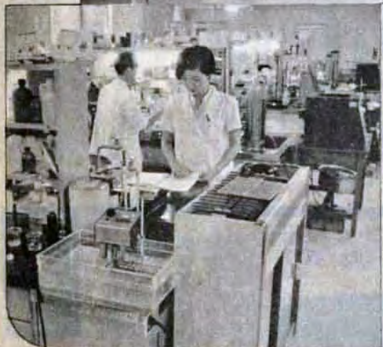
▲中央検査室では、あらゆる角度からデータの分析を行います