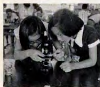
器具のそろった特別教室(戸畑区戸畑小)

勉強ばかりでなく子どもの身体づくりも学校教育の一つです。プールは46年度でほとんど完備運動場、屋内体育館(講堂)の整備も目下急ピッチで進んでいます。校舎の鉄筋化により広くなった分を利用するなどして運動場を整