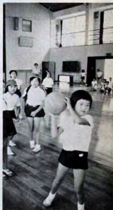
雨天のときは屋内体育館で(小倉区南ヶ丘小)

最近、市内小・中学校々々の鉄筋化が目につきます。これは市の基本方針として、木造校舎をなくして、将来はすべての校舎を鉄筋建てにしようとしているからです。 木造は、落ちつきやあたたかさなど、建物の造りが日本の風土にマッチして捨てがたいものがあります。一方鉄筋は、耐久性、土地利用の効率性、不燃性などの面で、木造に比