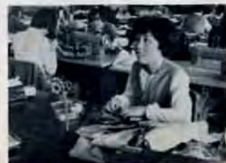
小倉授産所の作業風景

【募集人員】 10人—紳士服・婦人服 あみもの各部とも 【条件】 技術指導は無料。袖導後の工賃は出 来高払いです。年齢、経験は問いません。 【申込み】 11月15日までに、戸畑授産所(小 芝三丁目12—29、87局3897)へ。