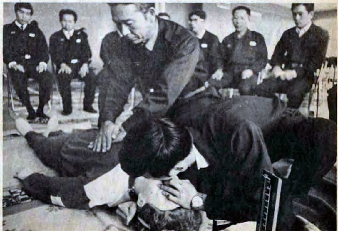
△ベテラン、新人もきびしい訓練が続く