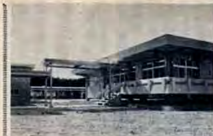
精薄施設「小池学園」(小敷)完成。