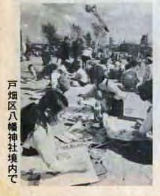
戸畑区八幡神社境内で

【ねずみ駆除運動】 11月1日～30日 期間中にかぎり、ねずみ（しっぽでもよい）を一匹二十円で買取ります。つぎのところに持参を。