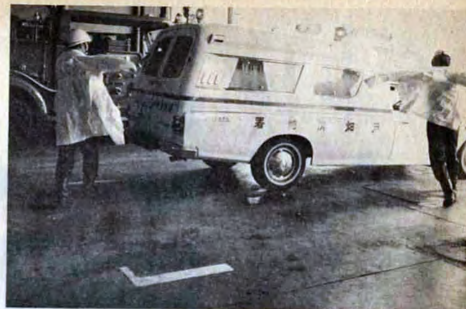
△出動!隊員の呼吸も合い、部屋を飛び出すのもほとんど同時