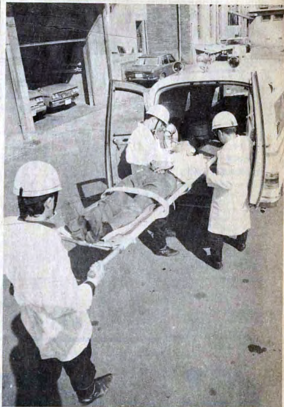
△現場での処置もテキパキ。応急手当をしたのち病院へ

ブザーが鳴る「ハイ、こちら119番!」 「戸畑区一校館洋線ガード下で交通事故。男2人、女1人が負傷しています。すぐ救急車をお願いします!」