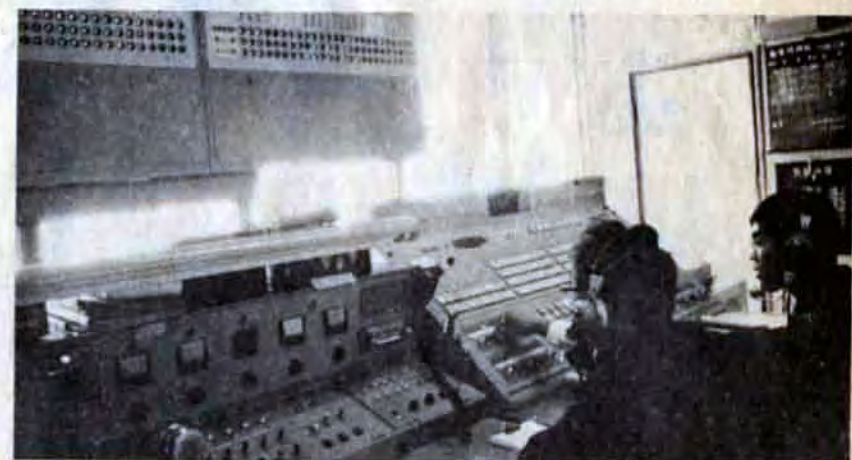
△最新式の通信設備をもつ救急指令センター。通報が多いときは食事もできない