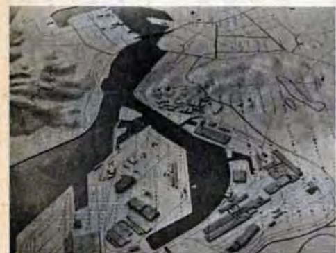
地形模型を作って、風速、風向などいおう酸化物の濃度を調べる風洞実験

環境基準を決める 市は、国と県の協力を得て、環境基準を達成するには、各工場はどのくらいの規制基準にすべきかを定めるために、44年12月から三菱重工(株)技術本部長崎研究所で風洞実験(費用は三千三百万円)をしました。