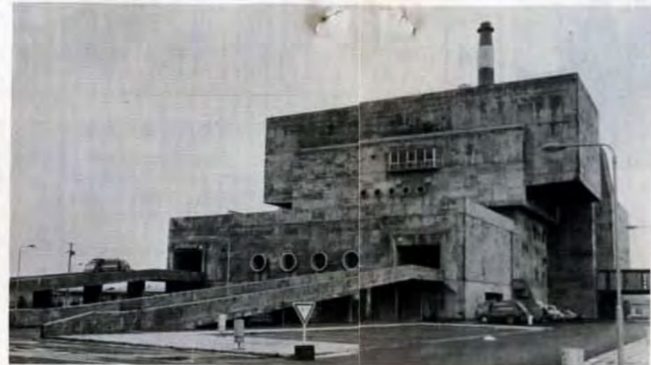
日明清掃工場の全景