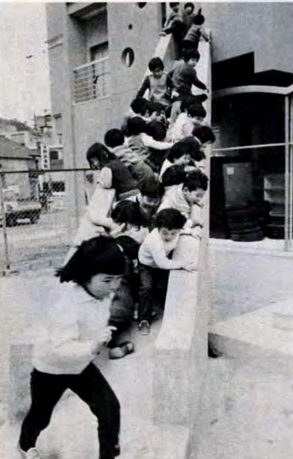
2階からの遊樂兼用すべり台で遊ぶ子どもたち(大蔵保育所)

保母さんに十分な休養を う設計に気を配っています。 大切なお子さんを預かる保母さんは、その世話をするためてんてこまい。お子さんのちよつとした変化にも気を配らなければならないのでとても疲れます。 そこで、私立保育所の保母さんが十分な休養をとり健康な身体で保育に従事できるように、ことしから五日間の代替職員費用の助成を行なうことにしました。 このほか、保母さんの研修会などで保育内容の充実をはかります。これら保育所など児童福祉に要する47年度の予算額は、昨年度に比べ五億七千九百万円増の九億五千八百万円です。