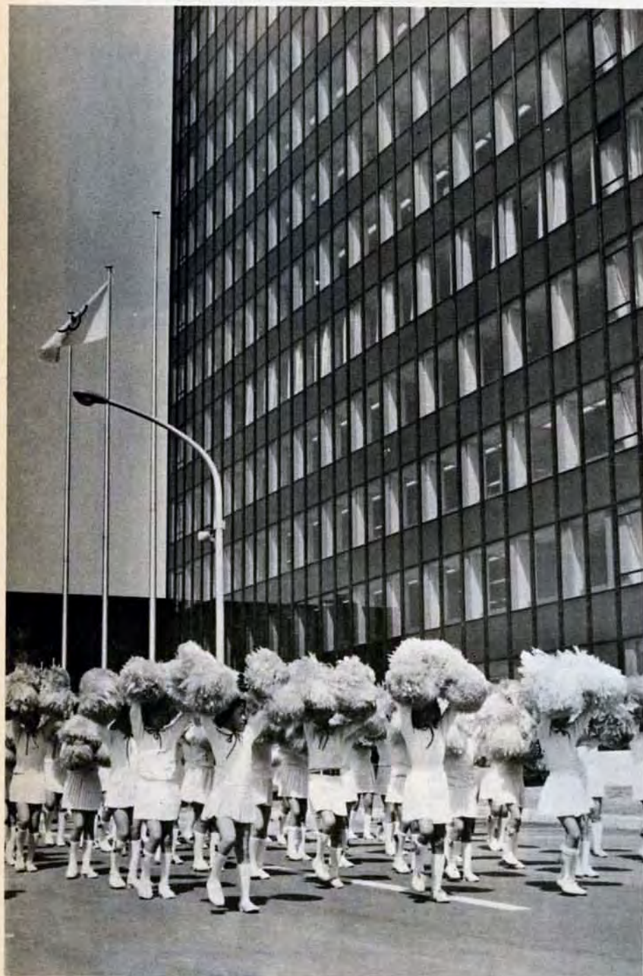
4月10日新庁舎前での祝賀パレード

市は、この期間中に市役所の窓口には身体障害者が来訪したときは、他の人に優先して手続などをすませる。身体障害者を待たせない運動。を実施していますので、市民のみなさんはご協力ください。また、つぎのような身体障害者へのエチケットをお守りください。 *ろうあ者に話しかけるときは、正面から話しかけてください。不意に肩などをたたかようなことをするとびっくりします。*ろうあ者との会話は、面倒がらずに口を大きくあけて、はっきり、ゆつくりと。中にはあなたの口の動きで何をいっているかわかる人がいます。わからない人には紙に書いてあげてください。 *足の不自由な人は、乗物などの乗降が大変です。手をかすか荷物などを持ってあげましょう。*手の不自由な人には、代筆をしたり荷物を持ってあげましょう。 *盲人には、あなたから先に声をかけてください。あなたの所在や方向、あなたが誰かを知ることができません。また、会話は握手してからしましょう。あなたに對する親近感がまします。