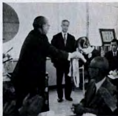
100か所目の保育の鍵を受取る園長

3月21日、市内で百か所目の保育所――すみれ保育所(門司区)が完成、一万人保育まであとひと息になりました。