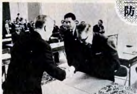
3月30日 54工場との防止協定の調印式

公害防止 協定では、各工場とめても(全重合着地濃度)ある基準以下になるようにと、法の基準より一層きびしいものになっています。 そして市民の健康を守るための環境基準を48年度までに達成するため各工場に改善計画を実施させ、現在よりいおう酸化物の排出量を減少させるようにしています。これは生産高の増加に伴い燃料の使用量も年々ふえる傾向にあるのに対し、いおう酸化物の排出量は現在よりも減らせようという事で、企業側にとってはきつい規制といえるものです。