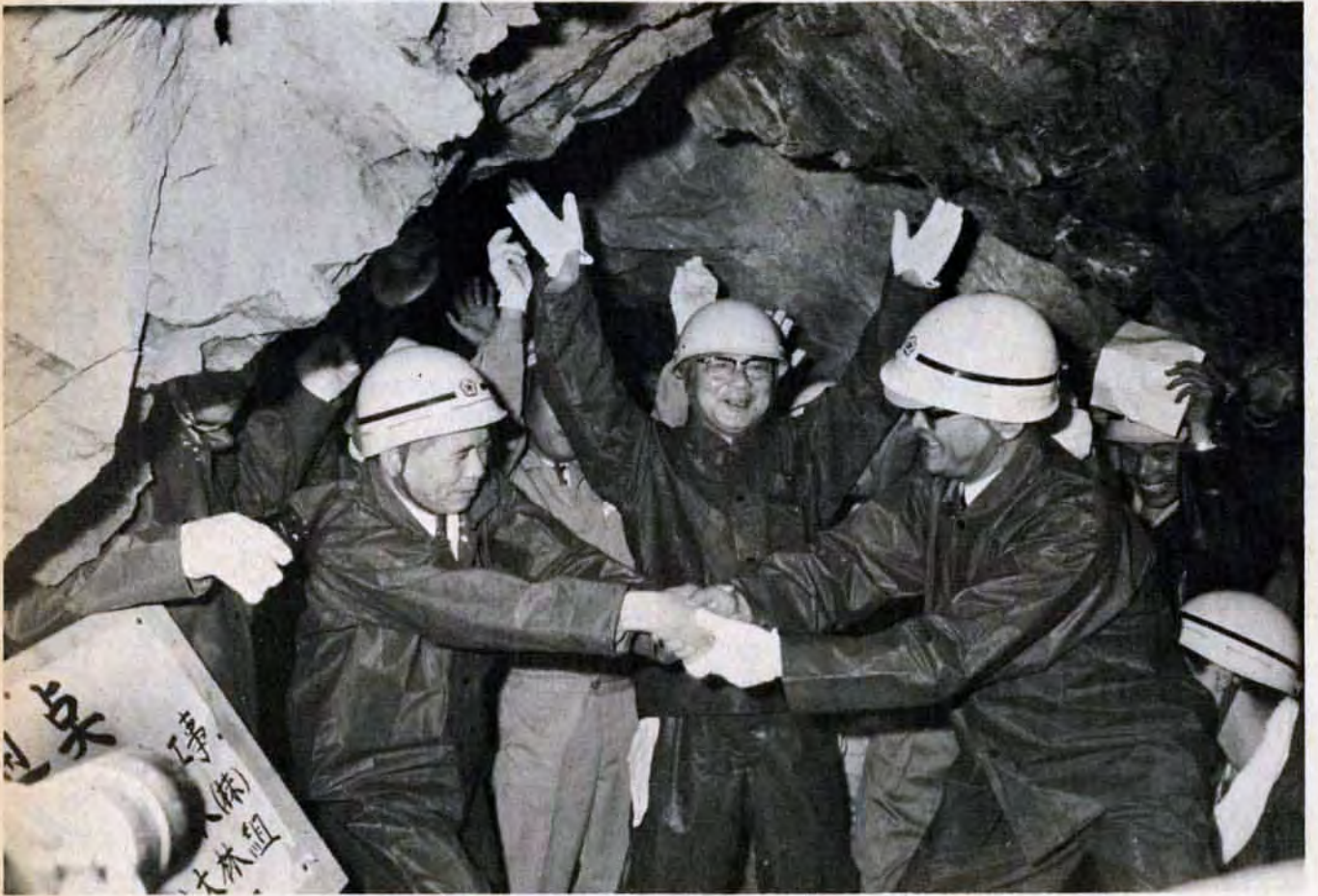
油木ダムと井手浦浄水場を結ぶ導水路の貫通式

4月1日現在の人口 ▶ 総数1,042,231人 ▶ 男504,106人 ▶ 女538,125人