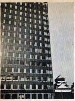
△小倉区 奥 敏康