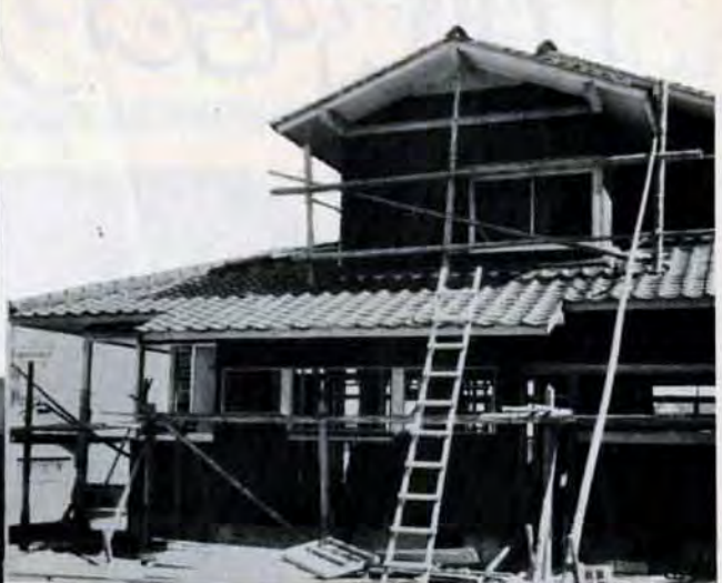
【住宅相談は】各区の市民相談室住宅係と建築局指導課助成係（市庁舎内、582局2531～2）では、マイホーム・ローンの相談に応じています。また、市庁舎1階の広聴課では、「建築相談コーナー」を行なっています。無料。気軽にご利用ください。