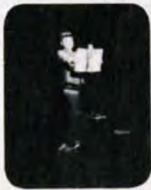
文を朗読すつろ君

日よう日にかぞくみんで、かつ山こうえんにいきました。 「おかあさん、でっかいチョコレートよ」とくいしんぼうのおとうとが空をゆびさしていいました。おかあさんとほくは、かおをみあつて「くすつ」とわらいました。おかあさんが、「あれは市ちようさんたちがおべんきようをするおうちよ。」と、