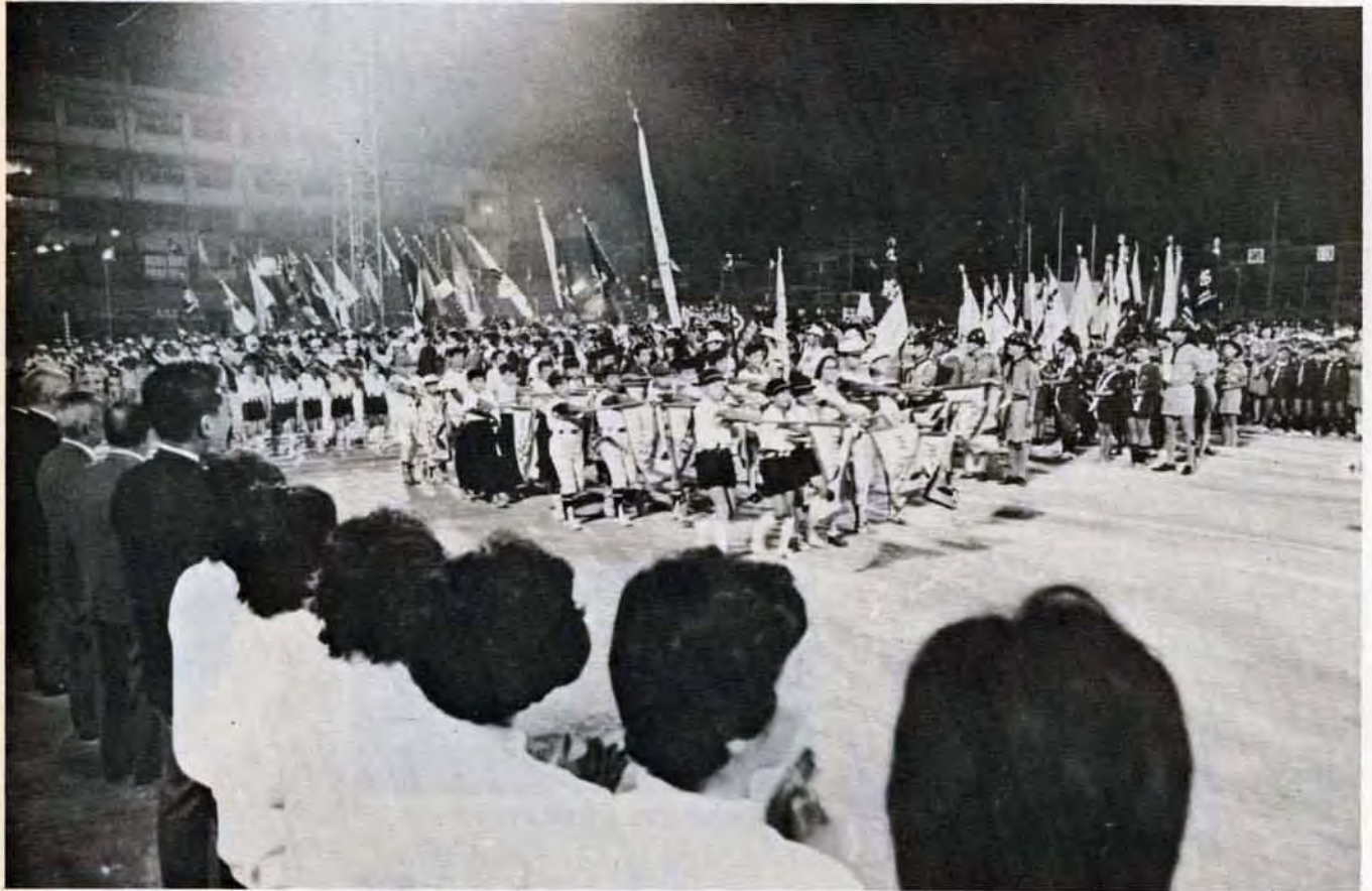
10月9日 戸畑浅生球場で行なわれた市民体育祭の前夜祭