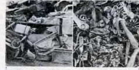
破砕処理前(左)と処理後のスクラップ

市は、このような現状と将来のゴミ事情を考慮し、小倉区西港町に総工費三億円で、粗大ゴミ破砕工場、を建設することになり、9