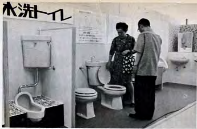
最近の便器は色もカラフルで清潔。花瓶の台にでも...

ウジがわき、ハエが発生、いやなおいの汲取り便所。また、工場や家庭の排水で、川や海はだんだん汚れ、やがては