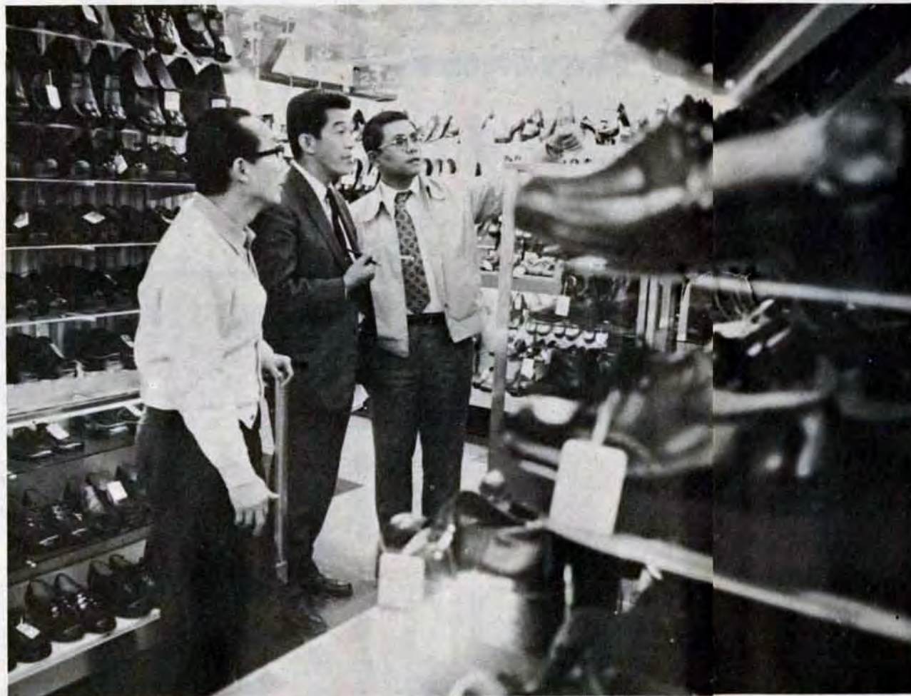
店舗改装の相談を受ける—診断士のインテリアデザイン感覚が活躍する時だ