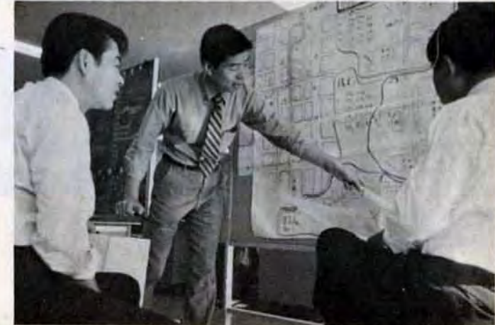
商店街診断—人の流れと尾行調査結果をもとに討論がかわされる

中小企業は、一般に、資本金が弱い、独自の製品を持つことが少ない、親会社やクシャミすればカゼをひく—などと言われます。特に、本市では、大企業への依存度が高い下請や関連企業が多いため、「カゼ」どころか「肺炎」にまでなりがちです。