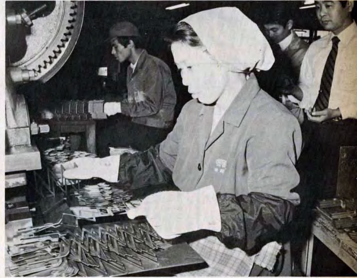
生産工程の細かな点までチェックし、記録を取る。診断の第一歩だ

診断士は、めまぐるしい経済界の動きを的確にとらえ、さまざまな業種のどのような問題をも診断しなければなりません。そのために、一年間、国の研修所でみっちりこまめな勉強を、常に勉強していかねばなりません。昨年度の診断件数は百六十件。年々、診断件数は増加しています。年末をひかえ、診断士は、ますます忙がしくなります。