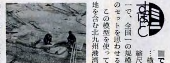
■てっかい実験 ：横62センチ、縦51センチ、縮尺六百五十分の一で、全国一の規模。まるで映画のセットを思わせる模型です。

届出・申出窓口は区役所市民相談室。提出書類は、(ア)届出・申出用紙(同相談室経済係にあります)・実測面積(わからなければ公簿面積)や譲渡予定価格、買取希望価格などを記入のこと (イ)土地の位置図 (ウ)土地の形状を書いた図面。お問合わせは、市財政局管財部用地課582局 2024へどうぞ。また、パンフレットは区役所市民相談室、出張所、市役所広聴課にあります。ご利用を。