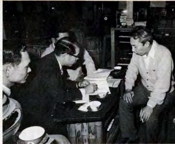
商店街や市場の診断会では、診断士の調査をもとに真剣な意見がとびかう