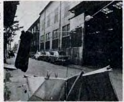
民家と工場が近接している沖台地区

会員企業九十四社の意識調査を実施し、移転理由や企業の業種を調べました。続いて移転する用地の獲得を図り、また実際に移転するにあたっての資料にするために沖台工場診断を行いました。 市は、47年12月に国から承認された公害防止計画の中にも、工場移転をとりあげており、積極的に援助することになっています。 移転候補地は、若松区二島地区（約三十ヘクタール）と戸畑区新川地区（約十八ヘクタール）。二島地区の方は、すでに昨年末、北九州市土地開発公社が買取り契約をしており、三年計画で52年度に移転が終わるよう協同組合の設立を急いでいます。この組合は移転事業の中心となるものです。