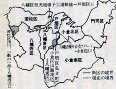
八幡区枝光越子工場敷地-戸畑区に

4月1日から小倉区は、おおむね北方城野地区を境に小倉北区と小倉南区にわかれ、八幡区は、桃園公園西側の道路で八幡東区と八幡西区にわかれます。また区境の一部を変更します(左下図のとおり)。 七区制の施行に伴い国や県の出先機関の受持ち区域も新区の区域にあわせて次のようになります 警察署 △小倉警察署 △小倉北区、小倉南区 △八幡警察署 △八幡東区、八幡西区 △折尾警察署(管内を除く) △折尾警察署(管内を除く) △折尾警察署(管内を除く) 法務局(登記所) △北九州支局 △小倉北区、小倉南区(曾根出張所管内を除く) △曾根出張所(小倉北区になった部分を除く今までの区域) △黒崎出張所(八幡西区(折尾出張所管内を除く)) △折尾出張所(今までの区域と浅川地区) 税務署 △小倉税務署(小倉北区、小倉南区) △八幡税務署(八幡東区、八幡西区、戸畑区) 財務事務所 △小倉財務事務所(小倉北区、小倉南区) △八幡財務事務所(八幡東区、八幡西区)