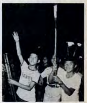
7月21日若松火まつり

「あき伍やポリ袋はくずかごへ」 あき伍やあきビン、ポリ容器などは、ぜったい海や川、山等に捨てないでください。私たちの自然を守るのはあなた自身の心から。