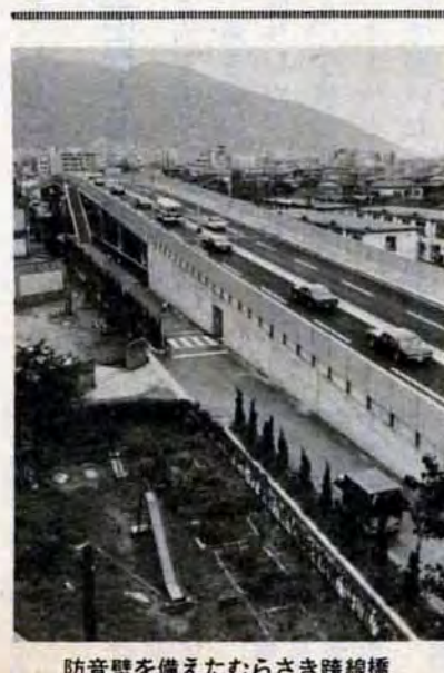
防音壁を備えたむらさき跨線橋

団体操で広がる日中の輪。7月14日市立総合体育館で日中友好体操競技大会が開催されました。まず選手同志が花束交歓。男性並みの演技をする南総殺し手。十四歳とは思えない技を見せる辛柱秋選手。塚原選手の月面宙返り等ウルトラCの連続に、観衆はうっとり。