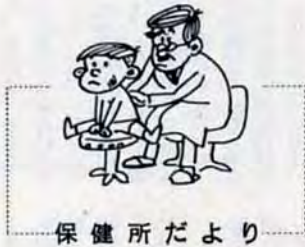
保健所だより 小倉南保健所 921局2186

▼8月21日、午前9時～11時。 当日は、朝食や糖分などをとらずにおいでください。受付は午前8時45分～9時。