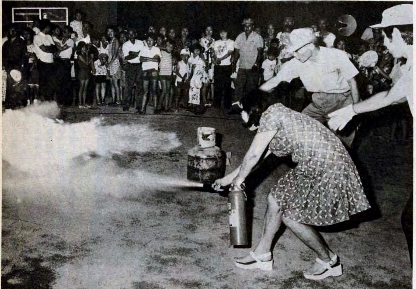
7月24日、小倉北区清水小学校で