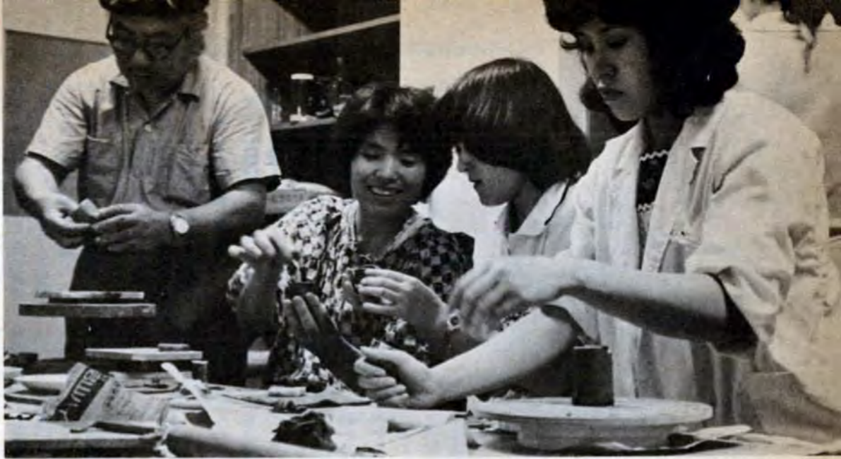
「これで飲んだらおいしいでしょうね、フフフ…」楽しい陶芸教室