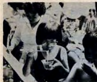
菅生の流でソーメン流し