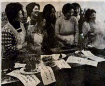
野草の（り）が自然の（み）を感じさせます（七草が食べる会・八幡東区）