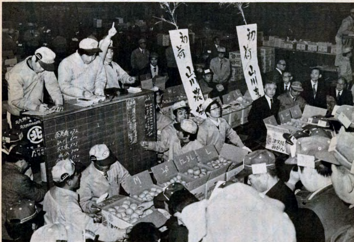
1月5日、中央卸売市場で、