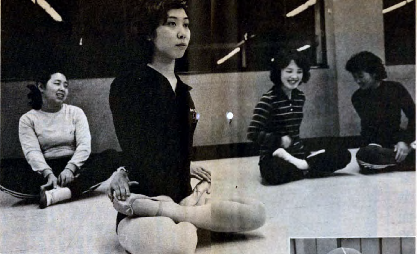
先生「呼吸を止めるのが大切」 生徒「呼吸より、足が曲がらなくて……」——（ヨガ体操教室・小倉北区）

沼（小倉南区）にも建築中（完成予定9月）。また古くなった公民館を逐次改築していく方針です。 「そうですね、やはり公民館というのは、まちの茶の間として気軽に利用してほしいですね。講座などに参加するだけでなく、たとえば町内の集まりや、子供会等の行事、体育レクリエーションなど趣味のグループなどにも使ってほしいですね」と公民館の職員。あなたもぜひ利用してみてください。