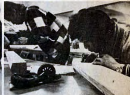
おやじの後を継いで大工にと猛勉強（建築青年学級・若松区）