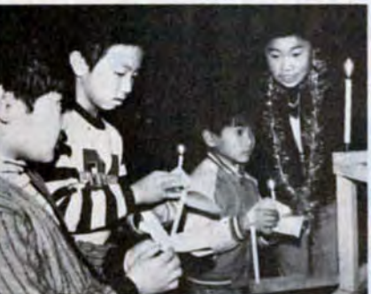
みんなで歌やゲームをするのが楽しいヨ（クリスマス会・戸畑区）