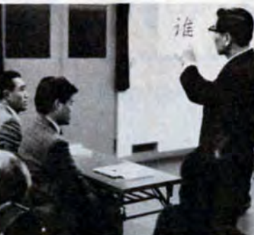
ことしは中国展もあるので、いまから楽しみ（中国語講座・門司区）

初心者から上級者まで、どなたでも参加できます。定員は百人。 日程は、2月18日～23日。大会は22日、大山又平場で。 費用は、一万九千五百円（宿泊費、講習費、参加費、傷害保険料など）。なお、スキー大会に参加する人は、参加費五百円。 申込みは、市体育協会（市教育委員会体育課内、82局2305）へ。