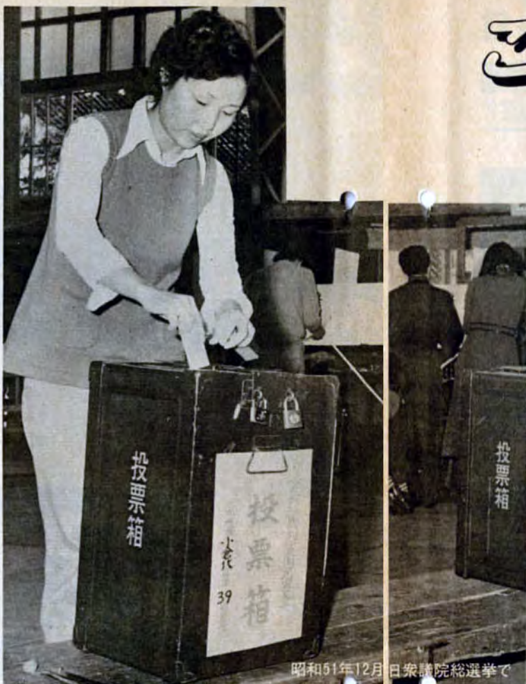
昭和51年12月 日衆議院総選挙で