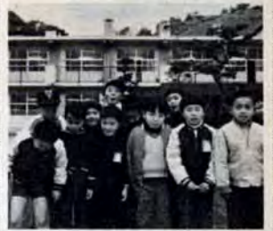
「三学期元気にスタート」始分登校の川小学校の児童ら。1月8日は市内小中各校の児童が、109人があつきました。お楽しきの冬休みが、1月15日まで続きます。