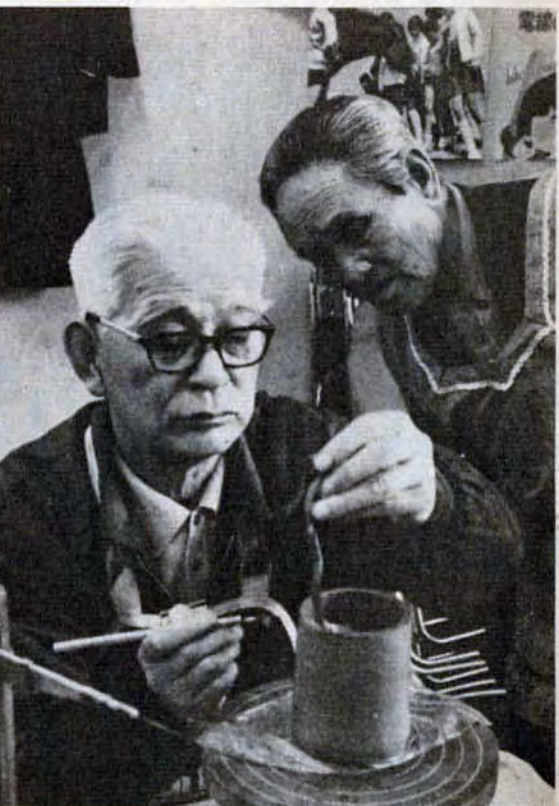
成人の日に記念のコーヒーカップを贈ろうと思って（陶芸講座・小倉北区）