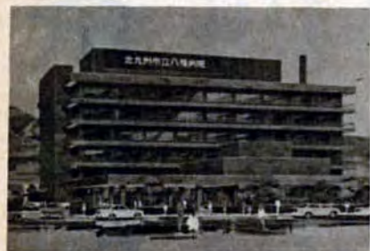
改築後の市立八幡病院

改築後は、脳外科を診療科目のなかに加え、現在の内科、外科などに合わせて診療科目は十四科目になります。 ベッドは、一般ベッドが二百四