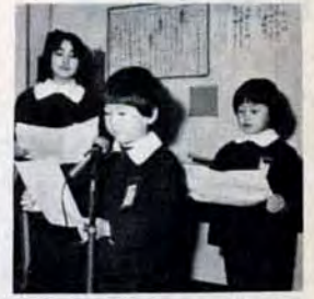
さあ三学期... 1月8日市内小中学校で始業式。中原小学校では、1・3・5年生の校内放送「冬休みの反省と心がまえ」から始まりました。