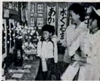
チビ子の力作がズラーリ

「アレッ、この花なんて作っているの？」—10月21日~27日、市立児童文化センターで行われた「児童館合同作品展」。 市内14の児童館が友好と交流をめざし、刺しゅうや陶芸、習字、工作など約 500点を展示。「かんばって切ったのに貼る時に失敗…」と切り絵。「久しぶりの粘土遊びで楽しかったが、ボクの顔までまっ白になった」と作品にはチビ子の製作の苦労や感想が書かれていて、来館の人たちを楽しませました。