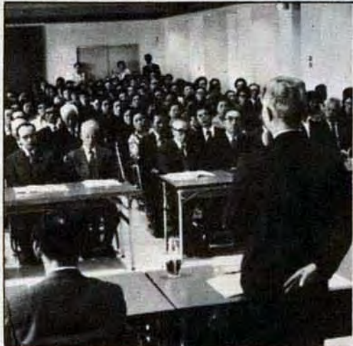
市長と語る会開く 10月25日、市庁舎で小倉北区の 市長と語る会が開かれました。これは、自治会、婦人会が 主催するもので市からは市長をはじめ助役などが出席。 公民館の新設や道路整備などの要望に耳を傾けていまし た。市長と語る会は、11月15日まで各区で行われます。