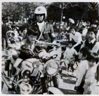
白バイに乗ってごきげんのチビッ子