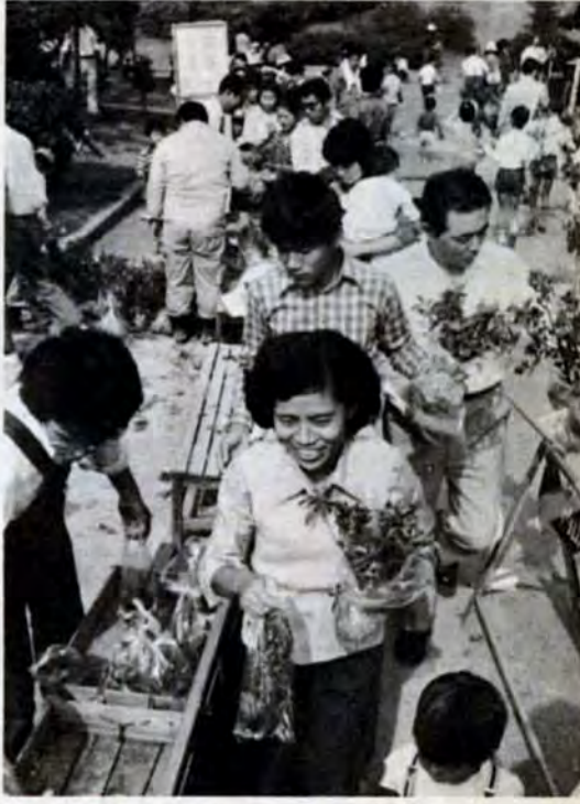
つつじ、さざんか等の苗木15,000本を無料配布