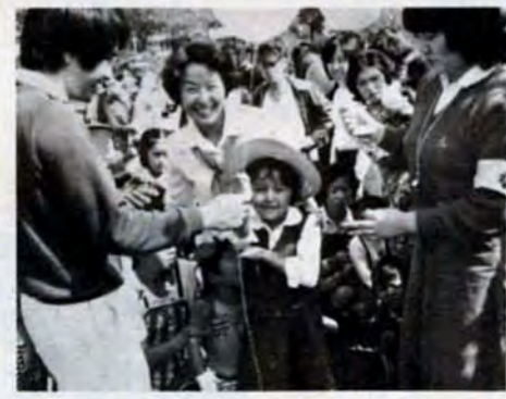
チビッ子たちに風船のプレゼント

第一次五か年整備計画(51年度末)では市内に三百十二か所の公園を新設、四十一万八千本の植樹をします。その結果、都市公園数は七百七か所、市民一人当たりの公園面積は四・八五平方メートルとなり、政令指定都市のトップ。