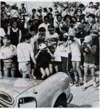
スーパーカーは子供たちに大モテ