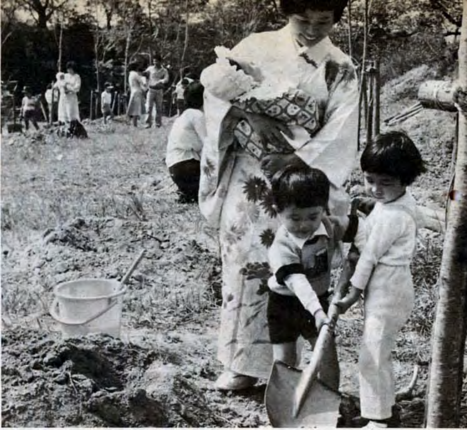
子供の健康を願って——八幡西区皇后崎公園で記念植樹

申込みは、11月9日までに同会館(八幡東区中央二丁目1-1、661局7334)へ。 【美容トレーニング二部】 毎週月曜木曜日午後1時30分〜3時。対象は主婦。受講料一か月千円。 【写真】 木曜日(実技講習)、日曜日(実地撮影)、いずれも月二回、午後6時30分〜8時30分。受講料は一か月千円。