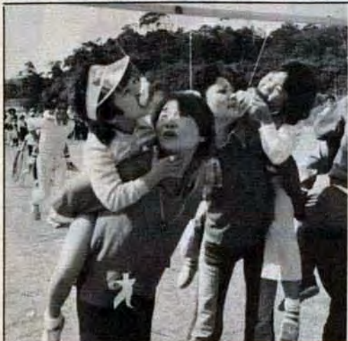
おひさまと遊んだチビっ子たち 10月16日、若 松区のおひさまのいえでは、開所二周年を記念して、親 子レクリエーション大会を開きました。集まった親子約 千人は、ハン食い競争のゲームやハイキング大会に楽し い一日を過ごしました。

入場口で入場券がわからなくなって、捜 していた時間のズレが 100万人目になった なんて…とてもいい記念になりました。