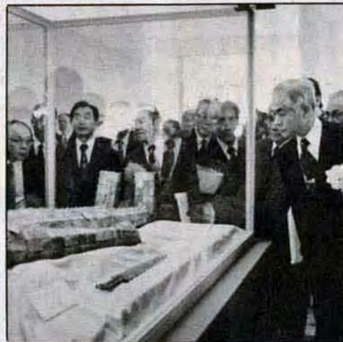
中国の歴史を探る11月22日から北九州市立美術館開館三周年記念として開かれている中国出土文物展の下見会。新石器時代から元の時代まで、陶磁器や立像、青銅器など新中国になって出土された展示品に、参観者は感嘆の声をあげています。文物展は12月18日まで開かれます。