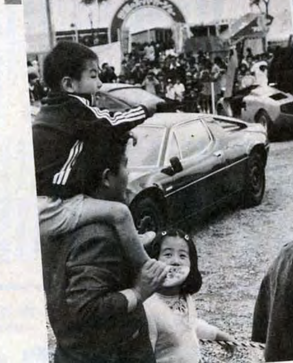
お父さん、あれがランボルギーニで、こっちがネエ……スーパーカー会場で