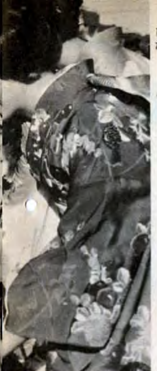
▼小さな手で大きな拍手—大谷広場特設舞台前で