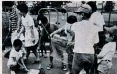
まち美化に精を出す浅生7町内子供会

この欄は、みなさんの地域での活動や活躍状況などを紹介する欄です。今までに区内の自治会やグループなどの活動ぶりを紹介してきましたが、もっともっと多くの人が活動していると思います。 あなたも、地域の運動会やソフトボール・バレーボール・ゲートボール大会、公園や地区の清掃、子供会のハイキングなどに参加したことはありませんか？ またグループで趣味を楽しんだり、何かの研究をしたり、慰問や奉仕活動等々を続けていませんか？ これらの活動は地域民との親睦を深めるだけでなく仲間づくりや体力増進、連帯感の補強、趣味の拡大・充実など、市がめざす、明るいまちづくりの基礎となるものです。自分たちの活動の意義、楽しさを他の地区にも伝え、生き生きとした、まち、を築きましよう。 市広報室広報課 87局2237ではみなさんの情報をお待ちしています。