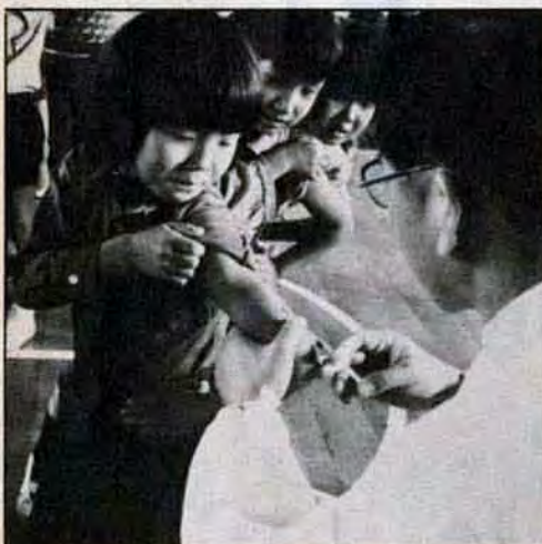
チョッピリ痛かったよ!! 12月15日まで市内でインフルエンザの予防接種が行われています。11月15日、西門小学校でもさっそく予防接種。「痛くなかった?」と、不安そうなお友達に、「チョッピリね」と答えます。さあ、この冬を元気に過ごしましょう。

イヤ、実に楽しいものです。つい先日も、みんなでワイワイ言いながら、たくさんのおもちゃを収穫したばかりなんです。