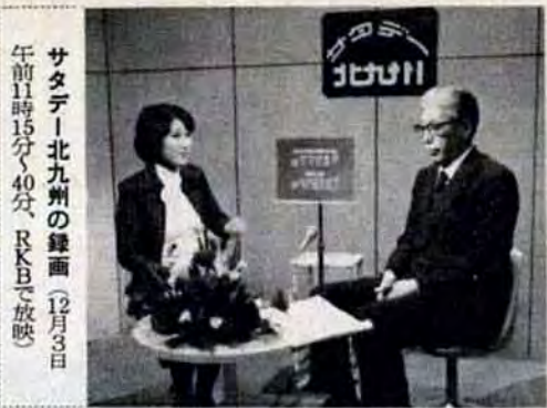
サタデー北九州の録画(12月3日 午前11時15分、40分、RKBにて放映)