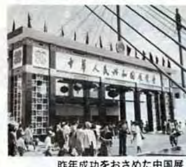
昨年成功をおさめた中国展