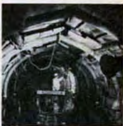
難工事の連続……下水道

次下水道整備5か年計画に着手。今年度 には、総額約190億円の費用を投じて、 下水道工事を急ピッチで進めています。 そして、昭和53年度の下水道整備事業 も、さらに拡大するものと思われます。 そこで、今回は、下水道局の職員のみ なさんの声を聞きながら、下水道のしごと を紹介することにしました。