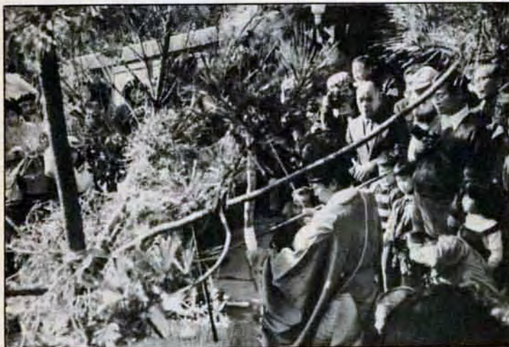
大きく振って豊作祈願!! 1月8日、小倉南区井手浦のしりの祭りが行われました。ワラで作った大蛇のまわりを神主さんら三人が腰を振り一回り。最後に神主さんが大刀で大蛇を見事に退治。集まった人たちは、これで今年も豊作まがいなしと大喜びでした。