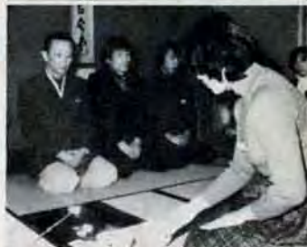
働く若人の茶道教室