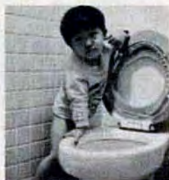
早く水洗化にしてネ

■雨水は雨水管・側溝へつなぎましょ う〱分式地区のみなさんのなで雨水を宅地 内へ汚水管つないでいる人がみられます