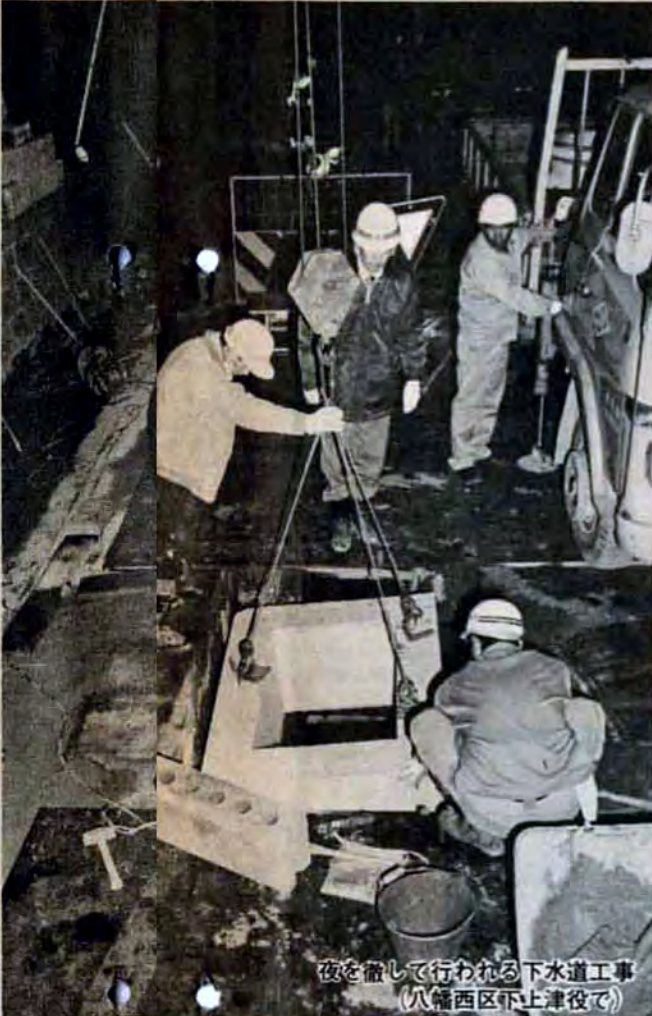
夜を徹して行われる下水道工事(八幡西区下上津役で)

安全で快適な生活環境をもつ都市—— 新中期計画で掲げたこの目標に向かって 市は、いろいろな施策を行っています。 なかでも、下水道整備事業は、汚れた 川や海をきれいにし、美しい自然をとり もどすものとして、都市には欠くこと のできない施策の一つです。 市下水道局では、昭和51年度から第4