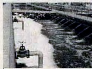
汚水は下水処理場で浄化され海・川へ

続きを代行してくれれます。ただ し、見積書をもらうことと、書類 の署名等はみなさんが確認して行 ってほしいです」と話しま した。