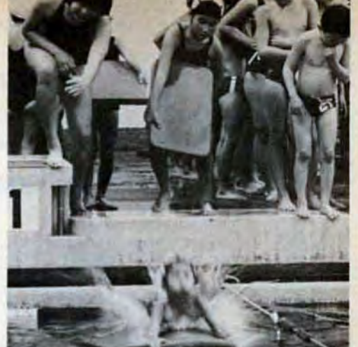
冬だって桃園プールはヘッチャラさ ●水の温度？ ちょうどいいヨ。体力作りと根性作りが目的。今日はクラブは休みだけど自己練習なの（八幡西区・松岡さん、小学生） ●みんな風邪をひかなくなりましたね（スイミングクラブの指導者）