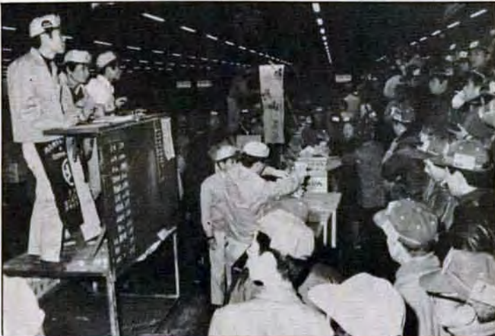
初せりて威勢よく年明け1月5日早朝、小倉北区の中央卸売市場で初せりが行われました。この日は、鮮魚七十二種、野菜・果物約六百万斤が初入荷。不景気風を吹き飛ばすような威勢のよい掛け声が、市場内に響きわたりました。

孤独な中老年の縁結び、ということで始めました。現在会員は152人です。もうすぐ第1号のカップルが誕生しますよ。