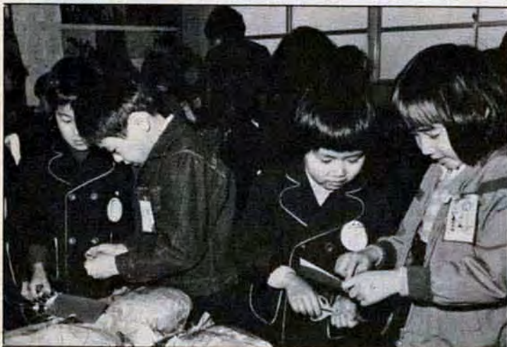
早く4月がくればいいなあ!! 2月17日、八幡東区前田小学校で新一年生が一日入学。これは、入学を前に少しでも学校に馴れてもらおうと開いたもので、校区内の幼稚園・保育所などから約百八十人が元気に登校。さっそく教室で先輩達と一緒に園工の勉強をしました。

幸運だったの! でも連続優勝してうれしかった。父も参加したんだけど成績は...ウフフ。来年もがんばります。