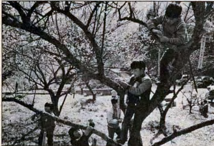
僕らのお願ひ、聞いて!! 2月21日、小倉南区三岳梅林で合馬小学校の児童約六十人が、札かけ・を行いました。これは、梅見シーズを前にして、毎年行っているもので、この日は「枝を折らないで」「木に登らないで」など児童の願ひを書いた竹の札をかけた。