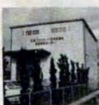
●石油ストーブは対震自動消火装置付のものを使いましょう

2月28日、石油コンビナート防災資機材西部備蓄センターが八幡西区相生町の八幡西消防署に完成しました。 これは昨年10月に完成した東部備蓄センターに続くもので、総工費約千六百万円、石油コンビナート等の防災体制強化策の一つです。