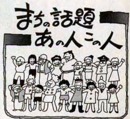
撮影協力ありがとう。本紙に掲載したあなたの写真をさしあげます。申込みは市広報室広報課 582局2236へ。

優秀賞8人のうち、男は僕ひとり。ウン、自分でも調子よくいったと思いました。できればアナウンサーになりたいな。