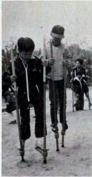
【写真上】右足からだぞ。イチ、ニイ、サン、どうだいうまいだろ