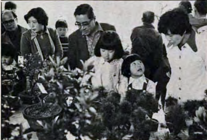
大盛況ノ盆栽展 3月18日〜22日、市立総合農事センターで開催。マツ・ツバキ・ツツジなどの盆栽に「枝ぶりがいいなあ」「まあかわいい」など語めかけた約二万人の市民はウットリ、また、即売会も同時に開かれ、約一万二千点の鉢物・庭木等が飛ぶように売れました。