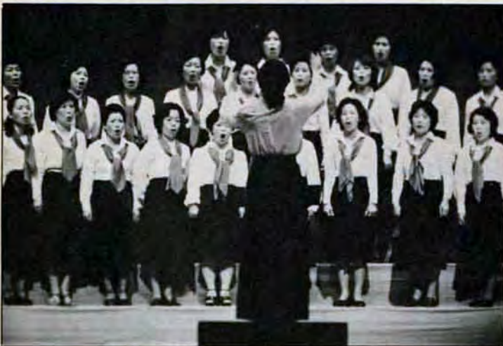
春を招くコーラス・フェスティバル 3月21日、八幡市民会館で北九州市制十五周年を記念して「レディコーラス・フェスティバル」が開かれました。市内の二十のコーラスグループが参加。日頃の成果が見事に調和した歓声となつて会場いっぱいになりました。

私は草花が大好き。だから、市街地にももっと緑をふやして、まちの中にも自然があるようになると、ステキだと思います。