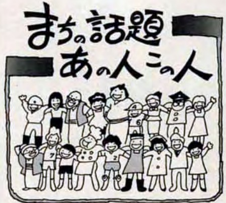
撮影協力ありがとうございます。本紙に掲載したあなたの写真をさしあげます。申込みは市広報室広報課 582局2236へ。

ネズミの絵は簡単と思ったら、ヒゲのところが難しかったよ。絵が大好き…大きくなったら絵かきさんになりたいな。