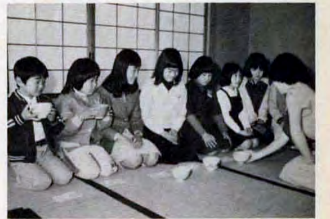
結構なお点前で…。会場に設けられた茶室は大好評