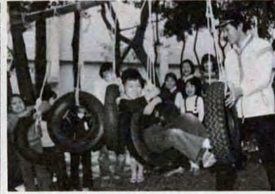
ぶらさがってはダメ。くぐりぬけるんだよ