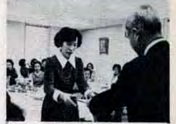
よりよい家庭づくりに…3月14日、勤労婦人センター・ミセスセミナーの修了式。年金や健康等の一般教養を学んだお母さんたち38人が、学長の谷市長から修了証書を受けました。