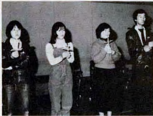
今日の思い出を明日に（キャンドルサービス）