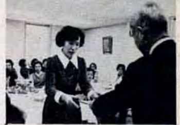
よりよい家庭づくりに...3月14日、勤労婦人センター・ミセスセミナーの修了式。年金や健康等の一般教養を学んだお母さんたち38人が、学長の谷市長から修了証書を受けました。