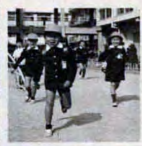
健康診査のあとには、保健指導を受けること、健康診査を受けたあとは、保健指導を受け、お子さんの育て方の指導をし、しつけや栄養、心身の発達状況等の相談に応じます。医師の健康診査をお持ちください。

健康診査は、市内に住む一歳六か月児を対象に、母子健康手帳を持ってステッカーをはっている市内の医療機関で受けましょう。無料。