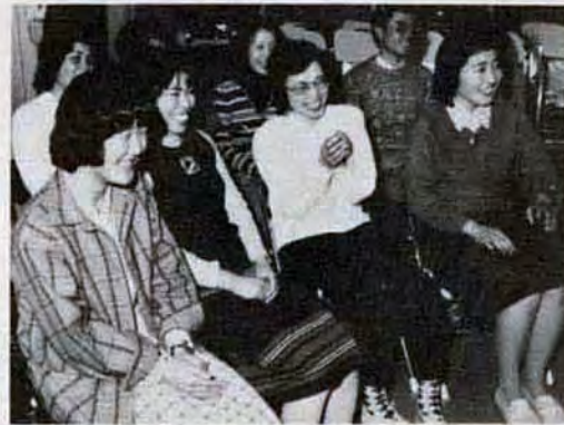
アレっ、音程がくるっちゃったかな