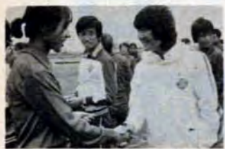
試合前の日中選手友好の握手。

9月11日、三萩野陸上競技場が 開場。15日には北九州大会が 開かれましたが、台風18号のため 中止になりました。