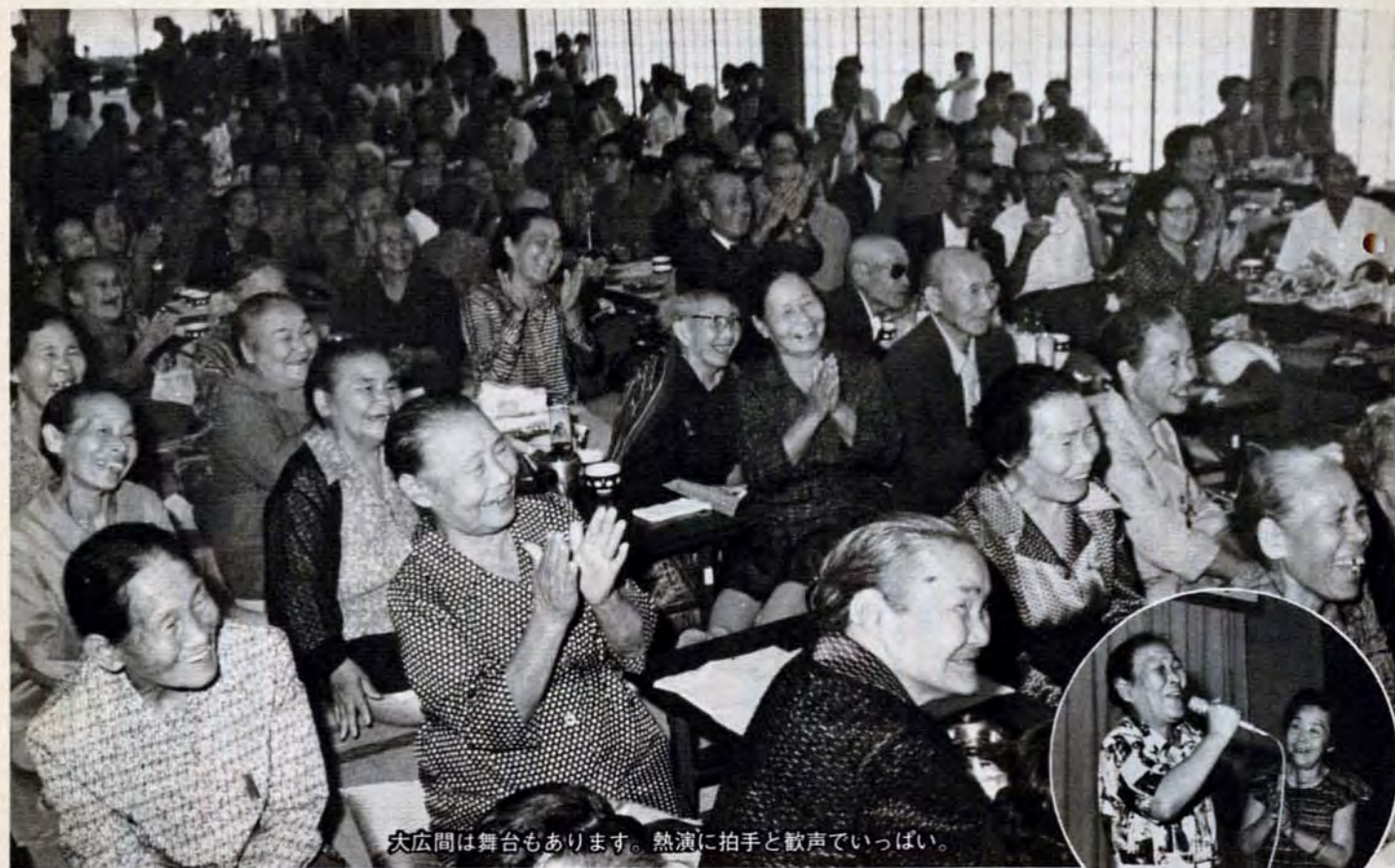
大広間は舞台もあります。熱演に拍手と歓声でいっぱい。