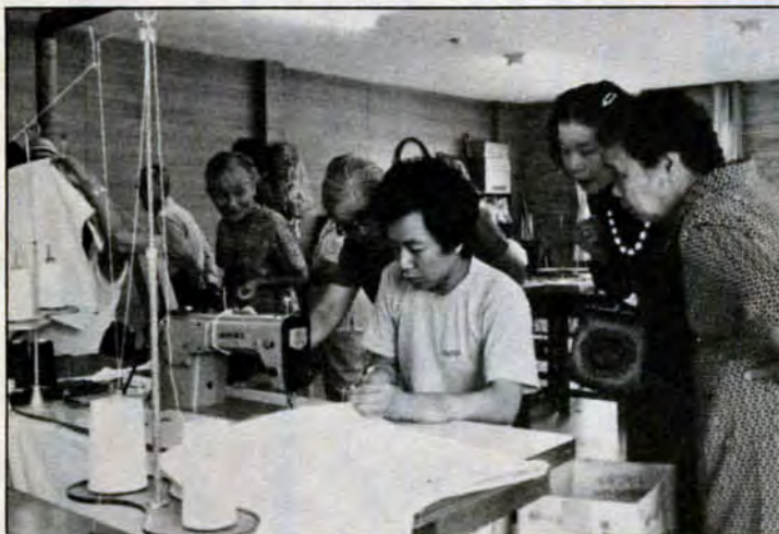
りっぱな出来ばえですわ—9月22日、「うごく市 政教室」を行いました。今回は、障害福祉センター、足 立作業所などの福祉施設を重点に見学。参加した人た ちは、係りの人の説明をメモしたり、施設の中では実際に 身障者のみなさんと仲よく語り合いました。