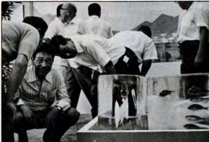
もっと魚を見直して！見つけよう魚のある暮 らし。をテーマに9月16日〜18日、小倉市民会館前広場 で「県移動水産まつり」を開催。会場には、県下の漁業 の歴史や将来を紹介する四台の展示車などを設置。訪れ た人たちに、魚の見直しを呼びかけました。

撮影協力ありがとうございます。本紙に掲載したあなたの写真をさ しあげます。申込みは市広報室広報課 582局2236へ。