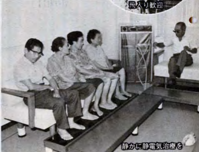
静かに静電気治療を

利用あない 【所在地】 門司区新門司三丁目5番地、481局3951 【開館時間】 午前10時～午後5時 【休館日】 毎週月曜日、祝日、年末年始 【使用料】 個人1人200円、30人以上の団体1人100円。ヘルストロン使用料は1人1回50円。 【交通】 ①門司駅前 ②門司港駅前 ③小倉平和通り——の各バス停から「恒見行」に乗車、終点で下車。終点から老人福祉センター専用バス(始発は午前10時10分)が約1時間おきに運行。