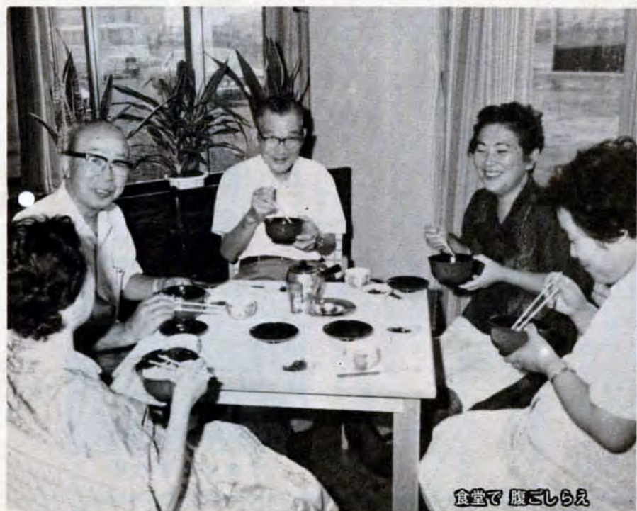
食堂で腹ごしらえ