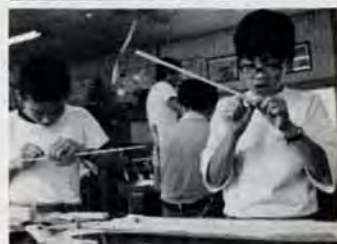
うまく飛ぶかな?—9月24日児童文化センターの模型飛行機教室。参加した子供たちは、手作りであって苦心さんたん。完成後は広場で飛行大会…航空ショーとなりました。

ポリオ生ワクチン 対象は、生後3か月〜18か月の人で、これまでに二回服用していない人 無料