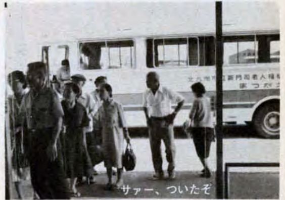
シャワー、ついたぞ

「完成を心待ちにしてたんですよ」「広々として、のんびりできますネ」——9月15日、門司区に新門司老人福祉センター「まつかえ荘」が開所しました。 このセンターは、お年寄りに健康で明るい生活と生きがいと健康の増進や機能回復訓練、レクリエーションの場として、また、親睦を深め合い、楽しい憩いの広場としての役割を果たします。 設備も、三百人収容の大広間をはじめ、一度に二十五人が入れる浴場やヘルストロン(電気治療器)を備え、また、周囲にゲートボール場やソフトボール場、インドアボウリングなどの整備を急いでいます。 今日もセンターは、大賑わい。大広間では、飛入りの歌や踊りに盛んな声援と拍手がわき上がっていました。