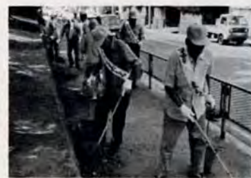
校区内をくまなく清掃

この団体は、年中行事のほか毎月一回、校区内の清掃と交通安全に力を入れています。定例日は、手に手にホウキを持った人たちが約二十人が、タスキ姿で勢ぞろい。戸畑駅前から商店街の通り、校区を駆々と清掃。八年前の発足当時、トラック二台分もあったゴミの山も、今では軽トラック一台。校区の人たちの「ゴミを捨てま