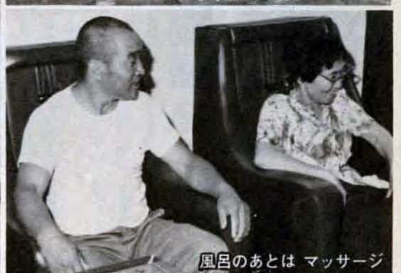
風呂のあとは マッサージ