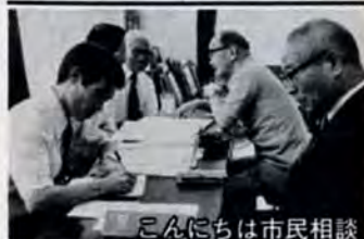
こんにちは市民相談