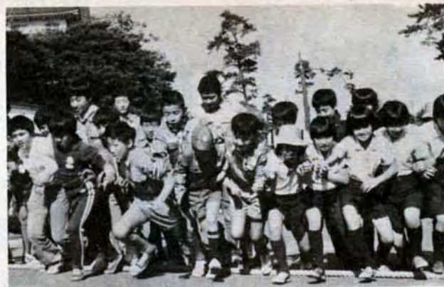
ヨーイ、ドンといっせいにスタート——マラソン大会