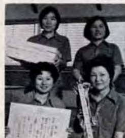
「優勝するとは思っていませんでした」11月5日、勤労婦人センターで行われた職業婦人卓球大会。八幡西区内の酒屋のお母さんチーム・酒販組合Aチームが、決勝リーグでも新日化A、市役所チームを破って、みごと優勝！

12月3日午前10時～午後5時、八幡東区の勤労者会館で。八幡西区身障者協会 661局0610が行うチャリティバザールです。当日の出品も受け付けます。