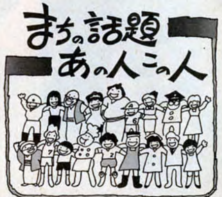
撮影協力ありがとう。本紙に掲載したあなたの写真をさしあげます。申込みは市広報室広報課 582局2236へ。

仕事や自分を見つめなおすつもりで書きました。調査員って何度も足を運ぶことかな。「お母さんもやるな」と子供がね。