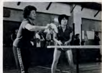
職場婦人卓球大会…11月5日、勤労婦人センターで、市内の職場相互の親睦をかねて卓球大会が行われました。優勝は、八幡西区の酒屋のお母さんチーム。あなたも、4人一組のチームをつくって第2回の出場を。