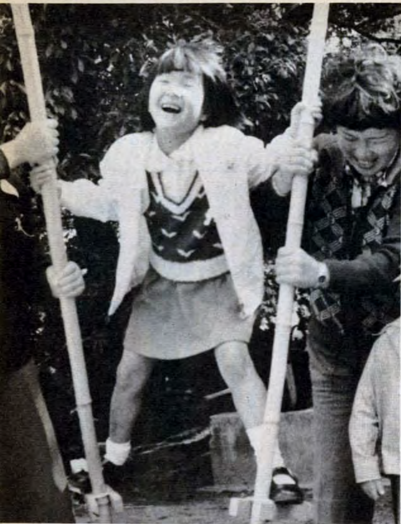
「ママ、落ちそう！」——竹うま遊び