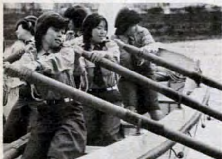
オールをそろえてヨイショ