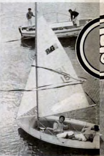
紫川にはヨットも参