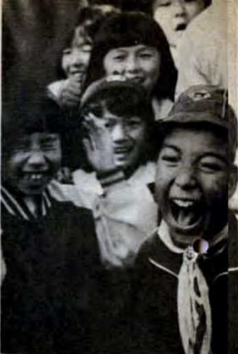
「ワー——」——と元気よく大声大