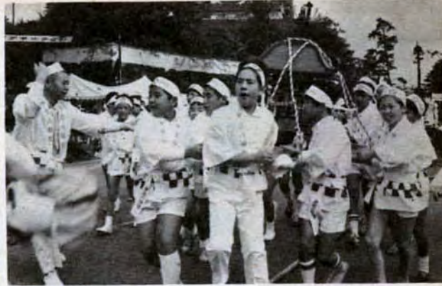
みこしだ/ワッショイ、ワッショイ