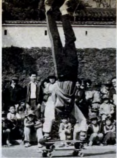
「かっこいいい！」——スケートボード大会