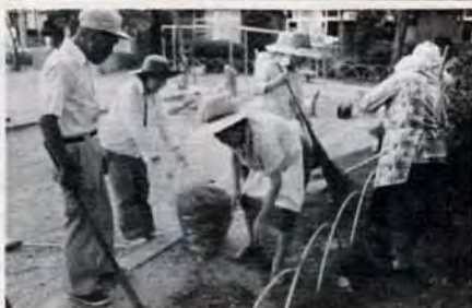
公園を清掃する第三区青々会の皆さん

月たっていない、一週間以内に他の予防接種をした、医師にしない方がよいといわれた人などの人。注意すること：前日に入浴する。当日の朝にお子さんの体温をはかる。お子さんの健康状態がわかる保護者が付き添ってくる。印鑑と母子手帳をお忘れなく。 【問合せ先】 若松保健所761局4045へ。 ねたきり病人 看護教室 対象は、家庭でねたきり病人の看護をしている人や、その他受講を希望する人。無料。 【日程】 11月20日午後1時～3時、若松保健所。 内容は、看護の実演(床ずれの予防と手当、体の向き方等)、最近の看護用品の説明と展示、座談会。