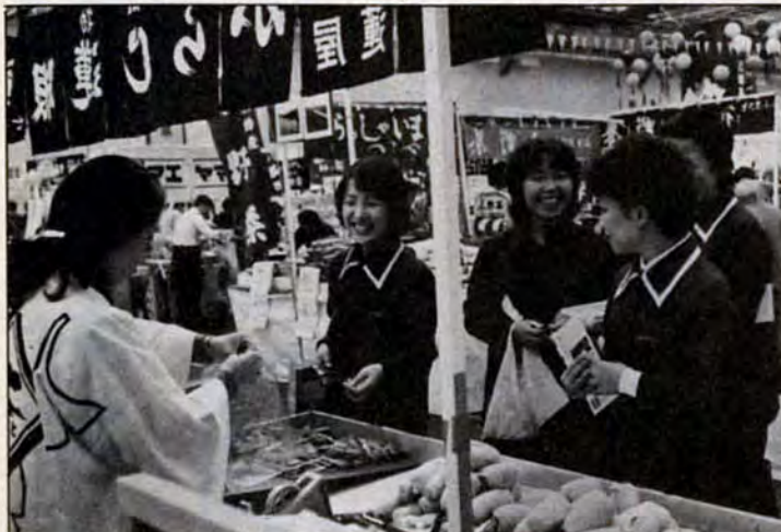
ふるさと自慢勢ぞろい!!「ネェ、これ去年の旅行で買ったのと同じよ。一旅の思い出がよみがえります。これは、11月1日〜6日、西日本総合展示場で開いた、西日本ゆたかな郷土展の「コマ、会場には、各地の名物がスラリ、十七万二千人の観客にぎわいました。