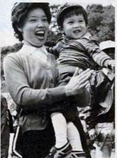
見物に来た坊やも思わずニコリ