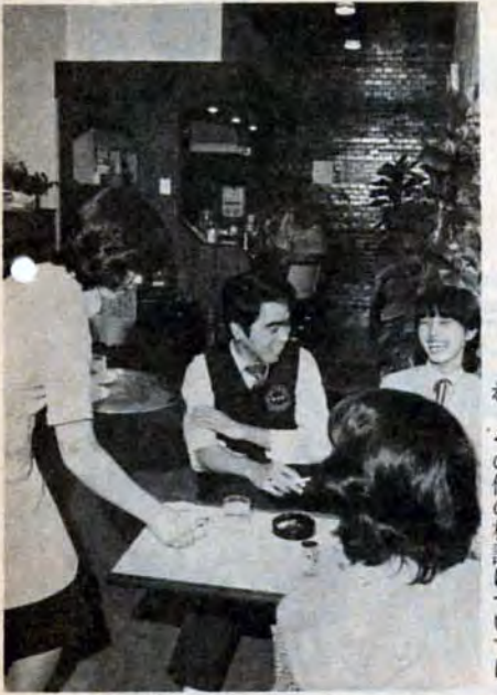
障害者による喫茶店「あい」(八幡東区)

答 障害者の人たちの自立更生は、究極的に雇用問題につきると考えます。また生活、職業訓練、求職活動の過程でいろいろな悩みが多いと思われるので、求職、就職の相談については職業安定所に担当専門官が配置され、その他の相談については、地