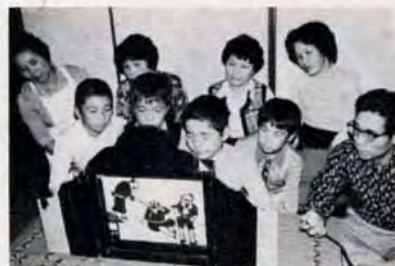
自作自演の紙しばい（沢見小チーム）

この欄は、みなさんの地域での活動や活躍状況などを紹介する欄です。今までに区内の自治会やグループなどの活動ぶりを紹介してきましたが、もっともっと多くの人が活動していると思います。 あなたも、地域の運動会やソフトボール・バレーボール・ゲートボール大会、公園や地区の清掃、子供会のハイキングなどに参加したことはありませんか？ またグループで趣味を楽しんだり、何かの研究をしたり、慰問や奉仕活動等々を続けていませんか？—これらの活動は地域民との親睦を深めるだけでなく仲間づくりや体力増進、連帯感の補強、趣味の拡大・充実など、市がめざす、明るいまちづくりの基礎となるものです。 自分たちの活動の意義、楽しさを他の地区にも伝え、生き生きとした、まちなを築きましよう。