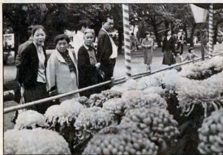
ふくいくと菊かおる!!11月1日、小倉城で恒例の菊花展が始まりました。「懸崖」「大輪」「盆栽云々約千点の菊がスラリ、中でも頭を並べた大輪には「きれいなえ」の声、松などを模した盆栽には「どうやって作るのかな」と首をうねる人がしきりでした。25日まで開催。

マンガは小さい頃から好きで…。それも読むより描くほうが…。受賞は意外でしたし、とてもうれしいですね。