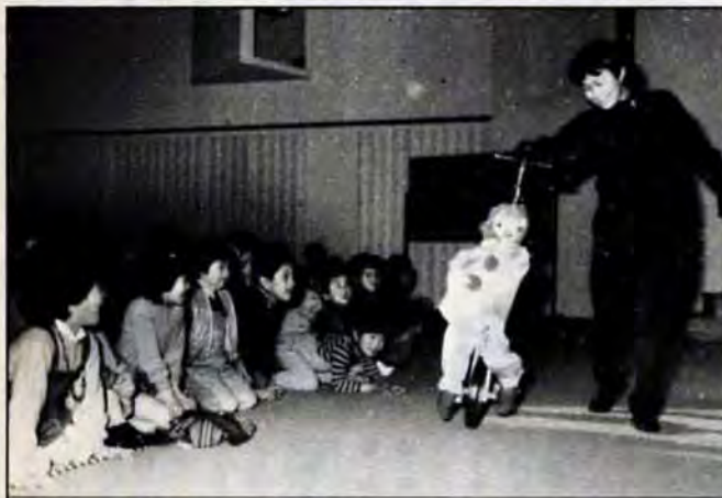
ゆかいなゆかいな人形劇—客席にまで飛び出してきた人形に、子供たちは大喜び—2月8日に開かれた「人形劇大会」は、こども文化会館を、ゆかいな童話の世界に変えてしまいました。