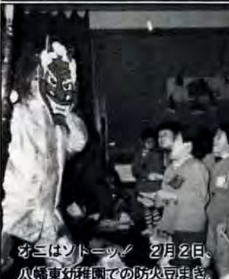
オニはソトノツノ 2月2日、八幡東幼稚園での防火豆まき。

無料相談 行政相談=2月19日、3月5日・19日 午前10時~午後3時、八幡東区役所相談室で。 大都市定例行政相談=3月12日 午前10時~午後3時、八幡大谷公民館(勤労者会館内)で。 巡回交通事故相談=2月20日、3月6日・13日 午前10時~午後4時 八幡東区役所相談室で。 年金相談=2月24日、3月10日 午前10時~午後4時、八幡東区役所相談室で。 心配ごと相談=毎週水曜・金曜日 午前10時~午後3時、八幡東区社会福祉センター(八幡東区役所裏)で。第4金曜日は弁護士面談。 法律人権特別相談=3月10日 午前10時~午後3時、八幡東区役所大会議室で。 買物苦情相談=2月16日 午後1時~4時、八幡東区役所相談室で。