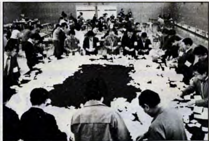
この1票が市政に反映—2月2日、市議会議員選挙の開票が行われた戸畑区会場。正確に早くと投票用紙を1枚1枚でいねいに開き二・三重の点検に、開票従事者は懸命でした。