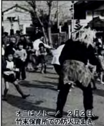
オオツキソト 2月2日、竹末保育所での防火豆まき。