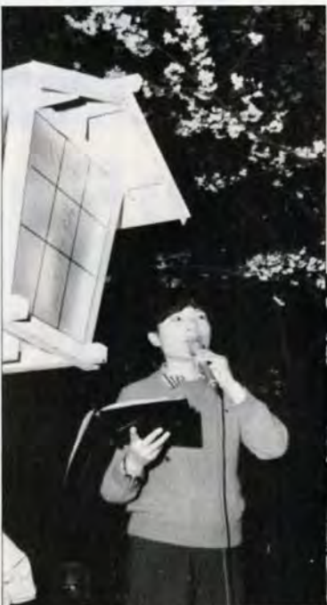
手作りのぼんぼりの下で得意のノドを披露—今日は団地の花見会

受付けは、4月20日、来年3月31日に各区役所市民相談室が市建築指導課・中高層賃貸共同住宅指導課へ。先着順受付け。 〈新築・建替・分譲〉 対象は、住宅金融公庫の貸付を受けて、自宅を新築する分譲住宅を購入する人。募集は六百五十戸。融資限度額は、木造四百十万円、耐火四百六十万円。年利六・五%（勤労者住宅の利子補給適用者は、年一%を3年間利子補給）。 〈改良〉 対象は、住宅金融公庫の改良資金貸付を受けて、自宅の増改築をする人。募集は五十戸。限度額は百万円。年利六・五%。 〈年長者居室整備資金〉 対象は、60歳以上の親族と一緒に住むため、年長者の専用居室を増築する人。募集は九十戸。限度額は百万円。年利六・五%。 〈中層賃貸住宅〉 対象は、市内に住む中高層賃貸住宅を建築する人。住宅金融公庫の中層融資を受けても、なお資金不足の人。募集は五百五十戸。限度額は二千五百万円。年利九・〇%。 〈共同住宅〉 対象は、市内に住む耐火構造で四戸建て以上の賃貸住宅を建築する人。募集は五十戸。限度額三千万円。年利九・〇%。 分譲住宅ありませう いすれも先着順受付け。公庫融資付。▼本城西（丸丸）団地。八幡西区。木造およびプレハブ住宅十六戸。二千三百円。▼千四百三十七万円。▼横代団地。小倉南区。プレハブ住宅四戸。千八百五十三万円。▼千九百三十七万円。▼香月ニュータウン。八幡西区。木造七戸。千六百六十七万円。▼千九百七十七万円。問合せは、市住宅供給公社総局4133。▼住宅金融公庫の融資説明会。4月22日午後1時30分から、北九州商工会議所9階で、定員二百人。無料。内容は、56年度の中高層耐火建築等の建設資金融資について。