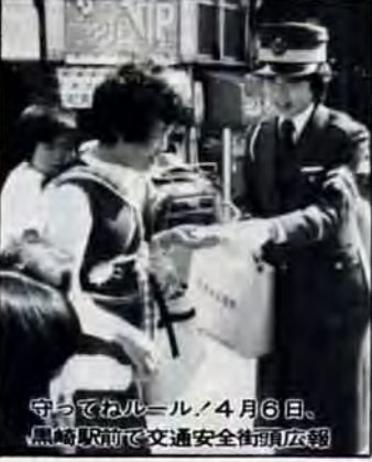
守ってねルール 4月6日、黒崎駅前交通安全街頭広報