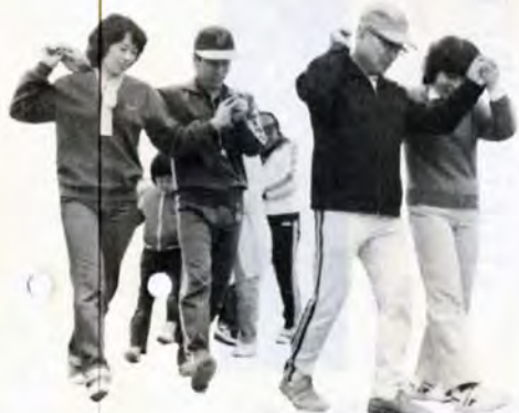
入学・卒業祝いの子供会ハイキング—「子供会に入る1年生です。よろしく」