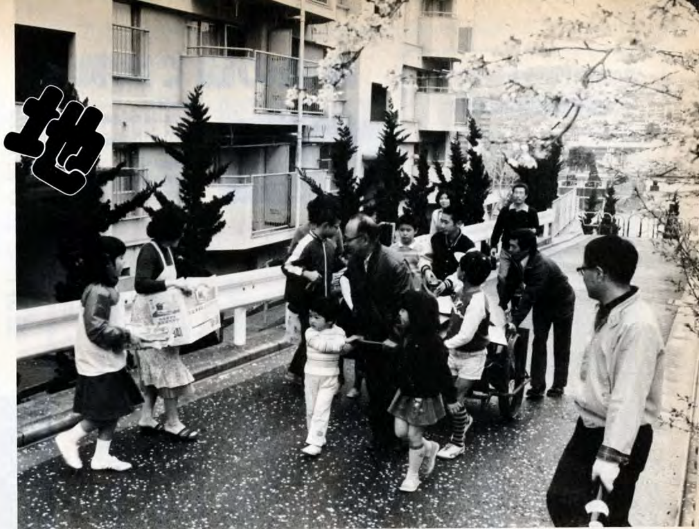
廃品回収の収益は子供会の活動資金となる