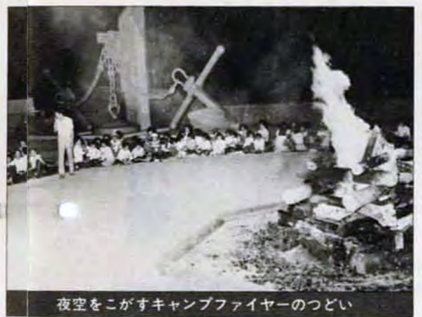
夜空をこがすキャンプファイヤーのつどい