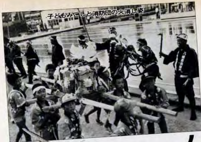
子どもみこしと消防団の火消し姿

「わしゃあ、孫といっしょに毎年見に来とるんじゃが、やっぱりええですなあ。特に、この火消し姿はわしら年配のものにはこたえられんバイ」と楽しそうなおじいちゃん。 ラストを飾る花火大会には、チビッコたちの楽しそうな歓声がこだましていました。