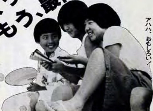
アハハ、おもしろい!