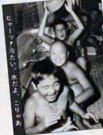
ヒヤッ!冷たい。水だよ、こりゃあ