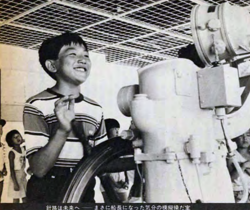
針路は未来へ——まさに船長になった気分の模擬操舵室

周防灘に面した門司区大字喜多久に、市内で3番目の少年自然の家が誕生、かくめよし(小倉南区)・たしろ少年自然の家(八幡東区)の森林地域にくらべ、この「もし少年自然の家」は海辺にあり、模擬操舵室やプールなどの施設のほか、海岸で磯遊びができるのが特徴です。 「うわあ、すごいや。ほんと、船に乗ってるようだよ。アツ、これが羅針盤かあ。面舵(まなぐわ)っぱい。へへっ、どうだカッコいいやろ?」とワンパク坊主も思わず、身を乗り出して夢中になっているのは、ま館の3階、模擬操舵室です。 このほか、海の学習ができる教材・展示品をそろえた資料室やクラフト作りが楽しめる工作室、体育館、プール、運動広場などがあります。 また、からだの不自由な子どもたちにも利用しやすいように、スロープ式階段なども特設しています。 さあ、君たちも「もし少年自然の家」の乗組員になって、未来へ針路を向け「出航」!