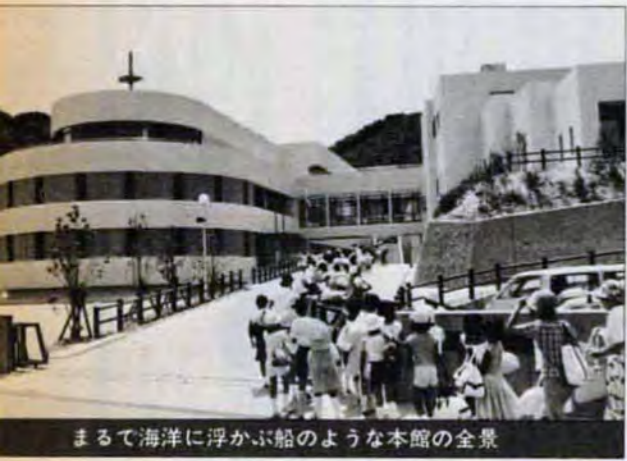
まるで海洋に浮かぶ船のような本館の全景