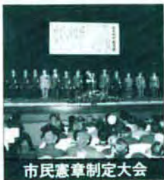
市民憲章制定大会