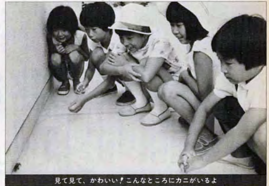
見て見て、かわいい!こんなところにカニがいるよ