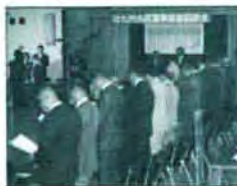
市民憲章推進協議会

体で構成する推進組織が、次々とおり結成され、これを中心に市民憲章の普及推進活動が進められています。